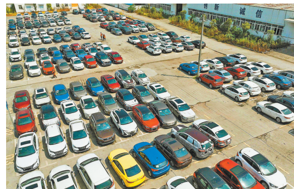
9月20日,位于潼南区的重庆弘喜汽车科技有限责任公司,部分回收的报废车停放在此。

四是支持校企协同创新。潼南将通过“引企入校”“引校进企”模式,大力支持下区内汽车后市场企业与重庆大学、南昌大学、重庆理工大学等高校合作,在科技创新、专利转化、人才培养等方面推动共赢发展。