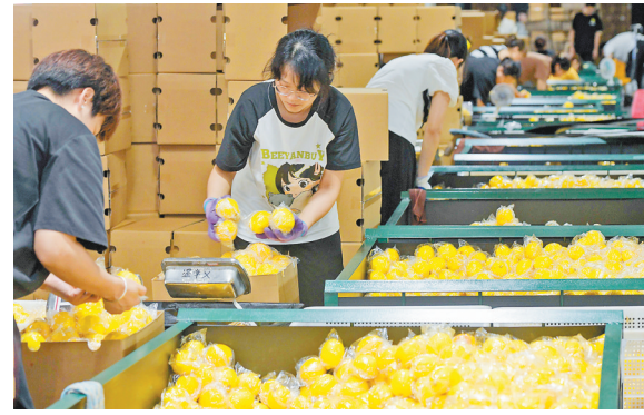
9月20日,位于潼南区的雪王农业(重庆)有限公司,工人在车间打包柠檬鲜果。