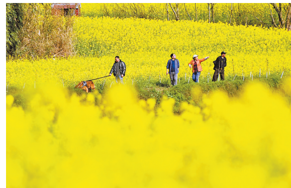
潼南区崇安镇陈村故里油菜花景区,油菜花大面积盛开,游客在花海游玩(摄于3月1日)。