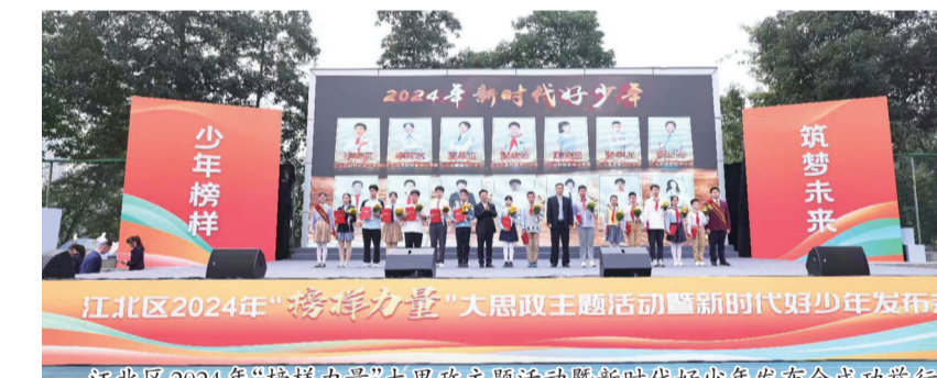
江北区2024年“榜样力量”大思政主题活动暨新时代好少年发布会成功举行

体中积极倡导新风尚。”活动相关负责人介绍,江北已连续7年多形式、多角度展示了135名“新时代好少年”和33名“新时代好老师、好家长”的先进事迹,营造了全社会关心帮助未成年人“扣好人生第一粒扣子”的良好氛围。