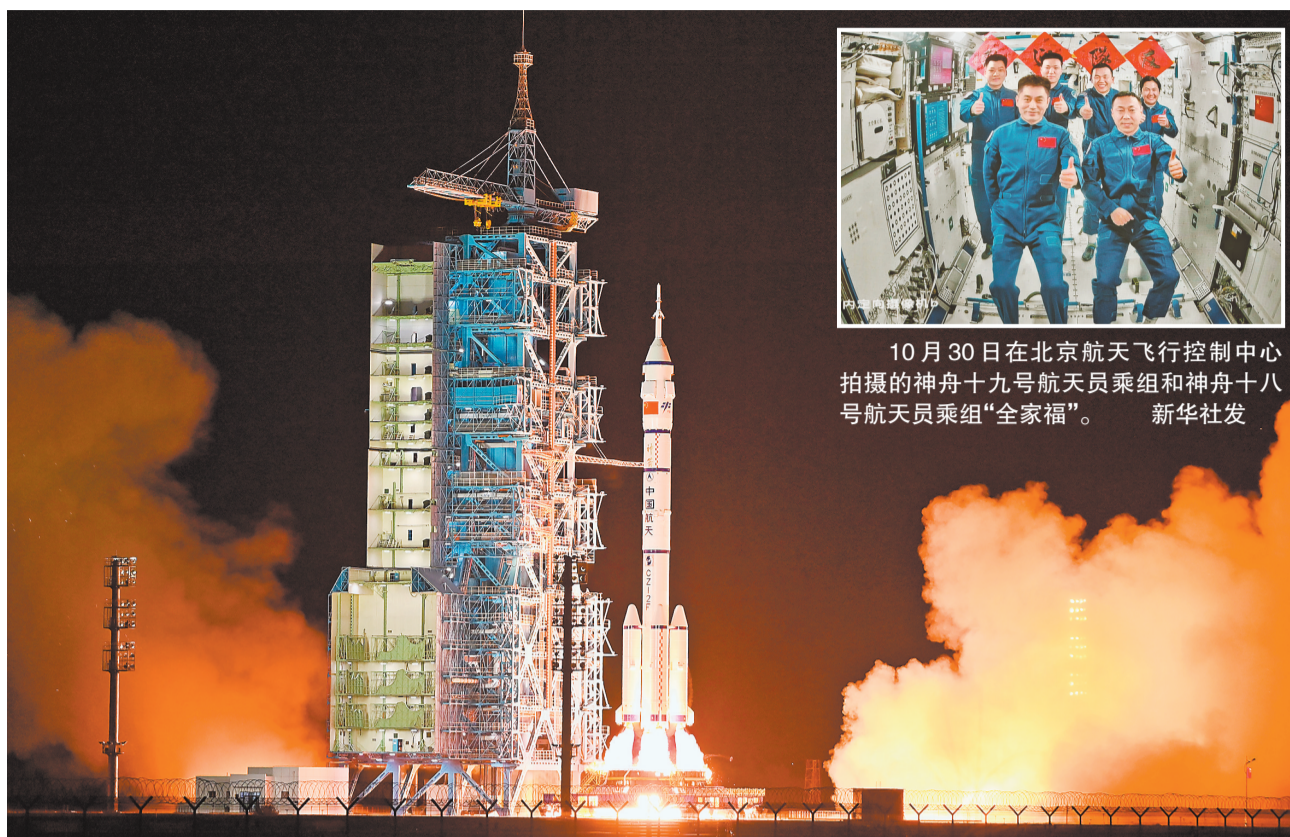
10月30日,搭载神舟十九号载人飞船的长征二号F遥十九运载火箭在酒泉卫星发射中心点火发射。

新华社北京10月30日电 (李杰 韩启扬)据中国载人航天工程办公室消息,在载人飞船与空间站组合体成功实现自主快速交会对接后,神舟十九号航天员乘组从飞船返回舱进入轨道舱。北京时间2024年10月30日12时51分,在轨执行任务的神舟十八号航天员乘组顺利打开“家门”,欢迎远道而来的神舟十九号航天员乘组入驻中国空间站,“70后”“80后”“90后”航天员齐聚“天宫”,完成中国航天史上第5次“太空会师”。