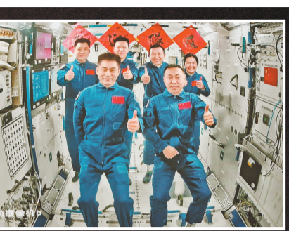
10月30日在北京航天飞行控制中心拍摄的神舟十九号航天员乘组和神舟十八号航天员乘组“全家福”。

后续,两个航天员乘组将在空间站进行在轨轮换。其间,6名航天员将共同在空间站工作生活约5天时间,完成各项既定工作。