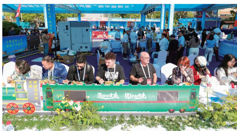
“义渡金手指”重庆小面技能展示交流活动现场

改革典型案例(第三批)向全市推广。今年1-9月，大渡口城镇新增就业10366人，登记失业人员就业3628人，就业困难人员就业1552人，前三季度城镇调查失业率均位列A档。