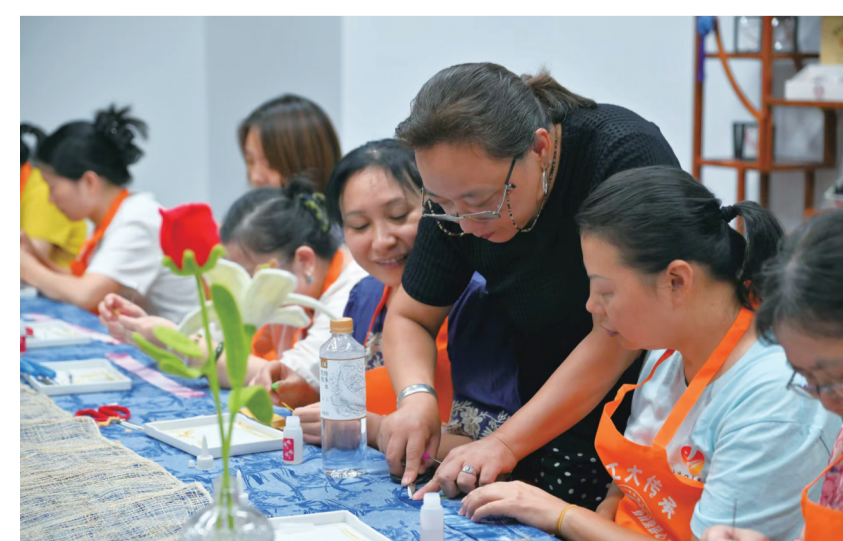
义渡壹秋堂非遗工坊里，一群居民围坐在一起，学习制作山茶花。