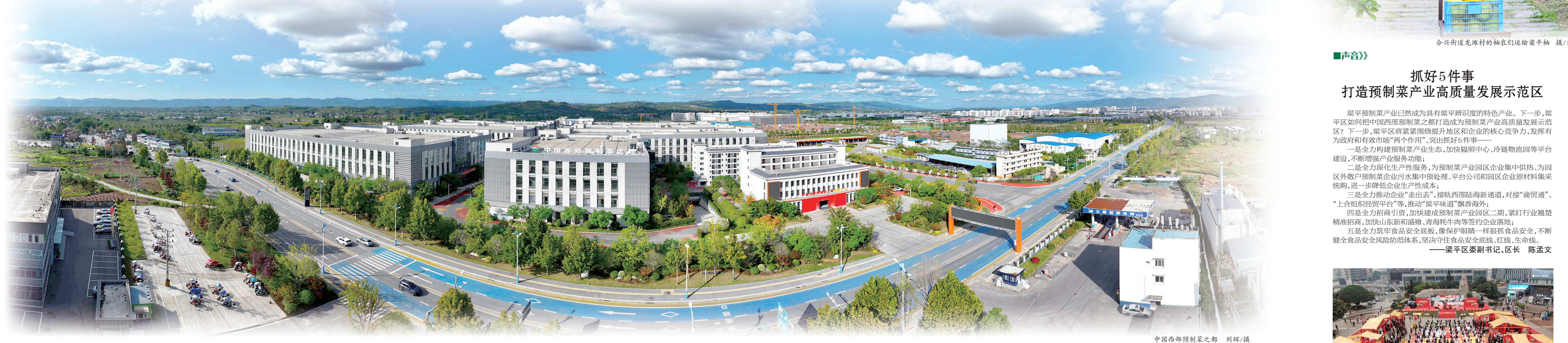
中国西部预制菜之都

梁平,坐拥巴渝第一大坝,拥有丰富的农业资源,是国家级重点产粮大区、全国商品粮基地、国家农产品质量安全区,享有“巴蜀粮仓”的美誉。近年来,梁平区立足以稻子、柚子、鸭子、竹子、豆子“五子登科”为代表的丰富农产品资源优势,把预制菜产业作为“强二产、带一产、活三产”的重要抓手,主动融入全市“33618”现代制造业集群体系,举全区之力把中国西部预制菜之都打造成为预制菜产业高质量发展示范区,助推全市食品及农产品加工业高质量发展。 到2023年,梁平区预制菜全产业链企业有318家,实现产值280.16亿元,增长18.6%。其中,2023年规模以上工业预制菜产业实现产值28.2亿元,占全区规模以上工业产值比重为32.6%,成为全区工业经济发展新的引擎,成功创建百亿级农产品加工业示范园区。