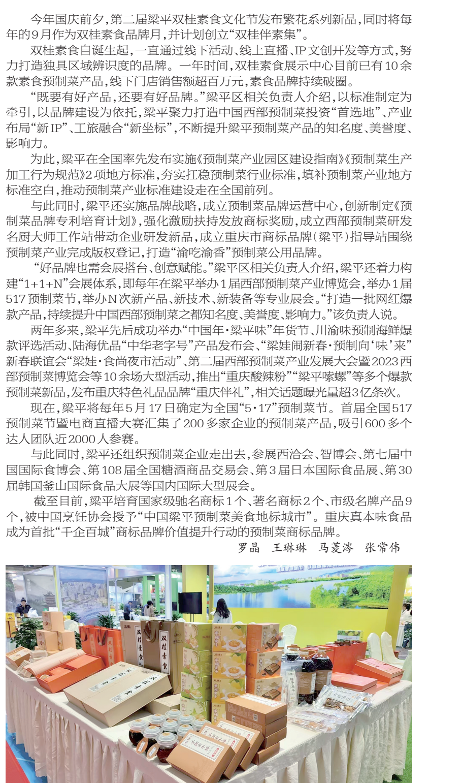
独具区域辨识度的双桂素食品牌多次亮相海内外展会

新品培育创品牌 这几年,梁平区奇爽食品有限公司(以下简称“奇爽食品”)在梁平柚综合利用深加工领域可謂硕果累累,既研发出梁平柚柚皮脱苦脱麻工艺,还陆续推出柚子发酵酒、柚子饮料、蜜柚干、柚子精油等产品。 “科技赋能,基本实现了梁平柚‘物尽其用、吃干榨尽’。”奇爽食品负责人介绍,他们有效集聚中国农大、江南大学、西南大学、中国柑桔研究所等高校院所的高端人才、先进技术、科技平台、科技信息等资源,牵头建成“重庆市蜜柚深加工企业工程技术研究中心”,承担“川渝预制菜关键技术研究与产品开发”等市级重点科技专项项目。该负责人说,“我们全面提升了创新能力,研发转化了一批科技成果。” 梁平农产品加工业体系虽然比较完善,但部分食品及农产品加工企业也存在重生产加工、轻科技研发的问题。为此,预制菜产业培育之初,梁平就注重加强科研,建设产学研平台,围绕预制菜产业柔性引进高层次人才10余名,从市农科院、菌科院、西南大学等选派市级科技特派员26名;新增预制菜科技专项投入5000万元,深化与中国农科院、江南大学等高校院所和龙头企业合作,加速新技术、新产品应用;加快建设预制菜产业大数,与中国预制菜产业联盟、赛迪顾问等合作,2023中国预制菜产业发展指数(梁平指数)已发布。 今年5月17日,重庆市预制菜产业联合体在梁平区成立。这也是全市5家新建培育产教联合体之一,旨在持续深化产教融合、科教融汇、校企合作,全力打造中国西部预制菜之都。 7月5日,国家农产品加工业科技创新联盟西部预制菜(重庆梁平)重点实验室又在梁平区揭牌成立,主要围绕梁平“五子登科”和其他农特产品加工、保鲜、加工关键技术突破、装备研发及新品开发等。 “创新引领和人才支撑,助力产学研协同创新。”梁平区相关负责人介绍,梁平围绕科技实施“双倍增”行动计划,实施“小巨人”企业培育工程,提升了科技创新能力,加快了新技术、新工艺、新产品研发和成果转化。 2023年,梁平区新培育食品及农产品加工业类科技型企业22家,国家高新技术企业20家。新增预制菜产业专精特新企业5家,累计达14家。