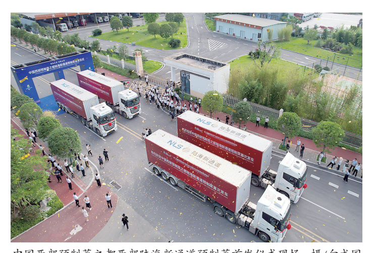
中国西部预制菜之都西部陆海新通道预制菜首发仪式现场

搭建平台优生态 今年3月,中国西部预制菜之都食品检验检测中心投入使用,可承接食品添加剂、啤酒色度、蛋白质、脂肪等13项食品参数检测,为预制菜产业高质量发展注入了澎湃动力。 “建设好产业平台,才能夯实预制菜发展地基。”梁平区相关负责人介绍,锁定发展预制菜产业后,梁平快速推进预制菜产业发展“三区五中心九平台”建设,搭建功能完善、信息畅通、体验舒适的预制菜产业平台,全力打造最优最全的预制菜产业生态。 “三区”即综合服务区、示范引领区、产业集聚区;“五中心”即研发中心、物流中心、电商中心、品牌中心、西部陆海新通道预制菜集散中心;“九平台”即综合服务平台、配套服务平台、运营平台、食材集采平台、西部陆海新通道预制菜集采平台、产业研究院、产业学院、中华美食文化园、英才之家等。 现在,梁平区相继建成了展览中心、体验中心、运营中心、博览中心、会议中心、电商直播中心、陆海优品展厅等,上线了梁平预制菜专题网站。与此同时,冷链物流园、预制菜产业园、产业大数、辐射中心等平台项目正顺利推进。 “一手抓加工,一手抓销售。”梁平区相关负责人介绍,梁平区还借助西部陆海新通道,在集散中心基础上搭建具有冷链仓储功能的物流中心,形成集仓储、加工、包装、配送于一体的物流基地,加快构建国际化的产业链供应链。他称,“这为‘梁平味道’走向国门进一步打开国际市场,奠定了坚实的基础。” 在打通预制菜出海大通道同时,梁平还与市政府口岸物流办合作,启动高新区智能化物流供平台建设,接驳寸滩港、新田港、新生港首批直达班车开通,万州海关梁平保税仓开工建设,与顺丰集团合作发展通用航空物流;启动500万吨级梁平火车站集装箱货运站场地拆迁,开工建设梁平至四川达州快速物流通道,全面提升内外畅联水平。 一手抓硬件建设,一手抓软件服务,梁平积极争取市级相关部门支持,及时发布《预制菜生产加工行为规范》《预制菜生产运营安全监管标准体系》等重庆市地方标准,完善食品安全监管体系。 2023年,赛迪顾问消费经济研究中心发布“2023十大预制菜产业基地”,梁平位居榜首。