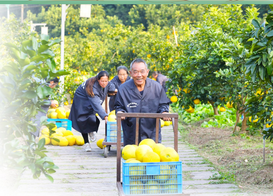
合兴街道龙滩村的柚农们运输笨柚