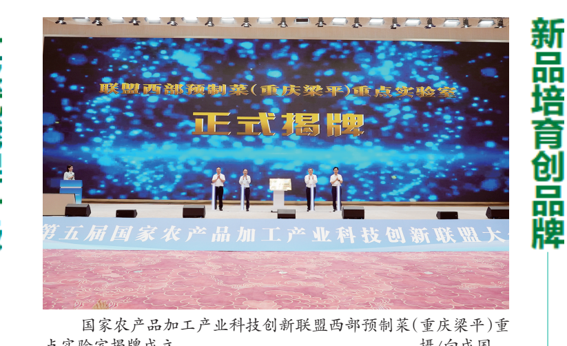
国家农产品加工业科技创新联盟西部预制菜(重庆梁平)重点实验室揭牌成立

科技赋能促升级 今年国庆前夕,第二届梁平双桂素食文化节发布繁花系列新品,同时将每年的9月作为双桂素食品牌月,并计划创立“双桂伴素集”。 双桂素食自诞生起,一直通过线下活动、线上直播、IP文创开发等方式,努力打造独属区域辨识度的品牌。一年时间,双桂素食展示中心目前已有10余家素食预制菜产品,线下门店销售额超百万元,素食品牌持续破圈。 “既要上好产品,还要有好品牌。”梁平区相关负责人介绍,以标准制定为牵引,以品牌建设为依托,梁平聚力打造中国西部预制菜投资“首选地”,产业布局“新IP”、工旅融合“新坐标”,不断提升梁平预制菜产品的知名度、美誉度、影响力。 为此,梁平在全国率先发布实施《预制菜产业园区建设指南》《预制菜生产加工行为规范》2项地方标准,夯实打稳预制菜行业标准,填补预制菜产业地方标准空白,推动预制菜产业标准建设走在全国前列。 与此同时,梁平还实施品牌战略,成立预制菜品牌运营中心,创新制定《预制菜品牌专利培育计划》,强化激励扶持发放商标奖励,成立西部预制菜研发名厨大师工作站带动企业研发新品,成立重庆市商标品牌(梁平)指导站围绕预制菜产业完成版权登记,打造“渝吃渝香”预制菜公用品牌。 “好品牌也搭会展舞台、创意赋能。”梁平区相关负责人介绍,梁平还着力构建“1+1+N”会展体系,即每年在梁平举办1届西部预制菜产业博览会,举办1届517预制菜节,举办N次新产品、新技术、新装备等专业展会,“打造一批网红爆款产品,持续提升中国西部预制菜之知名度、美誉度、影响力。”该负责人说。 两年多来,梁平先后成功举办“中国年·梁平味”年货节、川渝预制菜鲜爆款评选活动、陆海优品“牛年老字号”产品发布会、“梁妹闹新春·预制向‘味’来”新春联谊会、“梁妹·食尚夜市”活动,第二届西部预制菜产业发展大会暨2023西部预制菜博览会等10余场大型活动,推出“重庆酸辣粉”“梁平螺蛳”等多个爆款预制菜新品,发布重庆特色礼品品牌“重庆伴手礼”,相关话题曝光量超3亿条次。 现在,梁平将每年5月17日确定为全国“5·17”预制菜节。首届全国517预制菜节暨电商直播大赛汇集了200多家企业的预制菜产品,吸引600多个达人团队近2000人参赛。 与此同时,梁平还组织预制菜企业走出去,参展西洽会、智博会、第七届中国国际食品博览会、第108届全国糖酒商品交易会、第3届日本国际食品展、第30届韩国釜山国际食品大展等国内国际大型展会。 截至目前,梁平培育国家级驰名商标1个、著名商标2个、市级品牌产品9个,被中国烹饪协会授予“中国梁平预制菜美食地标城市”。重庆真本味食品成为首批“千企百城”商标品牌价值提升行动的预制菜商标品牌。 罗晶 王琳琳 马爱萍 张睿伟