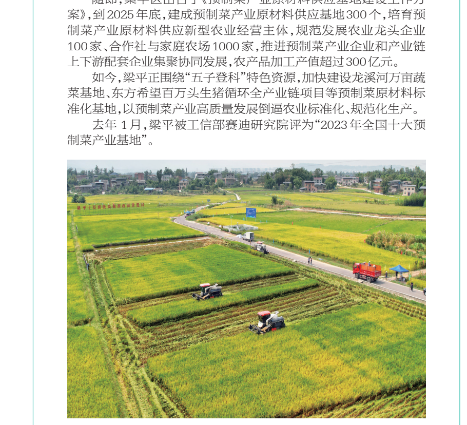
梁平享有“巴蜀粮仓”美誉,实现了水稻的优质高产

立足资源上新道 梁平区位于重庆东北部,与四川省达州市接壤,东山西山,横贯东西,六水同源,蜿蜒流畅。“梁山熟,川东足。”两山六水之间,沃野千里,田畴土润,用地条件良好,综合承载能力强,宜粮宜桑,宜果宜蔬。千百年来积淀的饮食文化,滋养出梁平大米、梁平小红糯高粱、梁平桂花酒、梁平榕村粽子、梁平豆腐、梁平香椿、梁平山笋、和生生姜、三新黄桃、梁平古梁山酒曲等“梁平味道”,形成了独具风味的“都梁食品”。 梁平有101万亩耕地,先后建成87万亩高标准农田,通过调优农业产业、产品结构和区域布局,做大做强“粮猪菜”保供产业,提质增效“柚竹渔”特色产业,大力发展稻子、竹子、柚子、鸭子、豆子“五子”支柱产业和蔬菜、渔业、生猪等特色产业。 “全区基本形成了‘一主两辅’产业发展格局。”梁平区农业农村委相关负责人介绍,2024年,梁平粮食播种面积99万亩,产量达36.3万吨;全区生猪预计出栏65万头以上,蔬菜面积和产量预计分别达到34万亩、75万吨;鱼菜共生A1工厂、对虾工厂全面投产,全区农林牧渔总产值预计实现105亿元。他说,“米袋子”“菜篮子”“果盘子”“肉铺子”供给充足,总体稳定。 预制菜产业一头连着田间地头,一头连着大众餐桌,符合“农产品向食品化升级、农业供给侧向需求侧升级”的趋势。为此,梁平区基于农业资源丰富、产业基础坚实,提出大力发展预制菜产业,全力打造“中国西部预制菜之都”,助推食品及农产品加工业高质量发展。 随即,梁平区出台了《预制菜产业原材料供应基地建设工作方案》,到2025年底,建成预制菜产业原材料供应基地300个,培育预制菜产业原材料供应新型农业经营主体,规范发展农业龙头企业100家,合作社与家庭农场1000家,推进预制菜产业企业和产业链上下游配套企业集聚协同发展,农产品加工产值超过300亿元。 如今,梁平正围绕“五子登科”特色资源,加快建设龙溪河万亩蔬菜基地,东方希望百万头生猪循环全产业链项目等预制菜原料标准化基地,以预制菜产业高质量发展倒逼农业标准化、规范化生产。 去年1月,梁平被工信部赛迪研究院评为“2023年全国十大预制菜产业基地”。