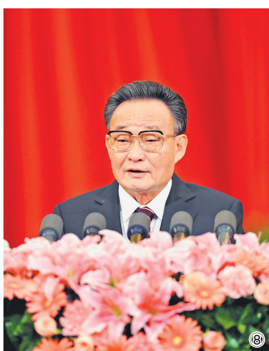
图⑧：二〇一一年三月十日，十一届全国人大四次会议在北京人民大会堂举行第二次全体会议。吴邦国同志作全国人大常委会工作报告。