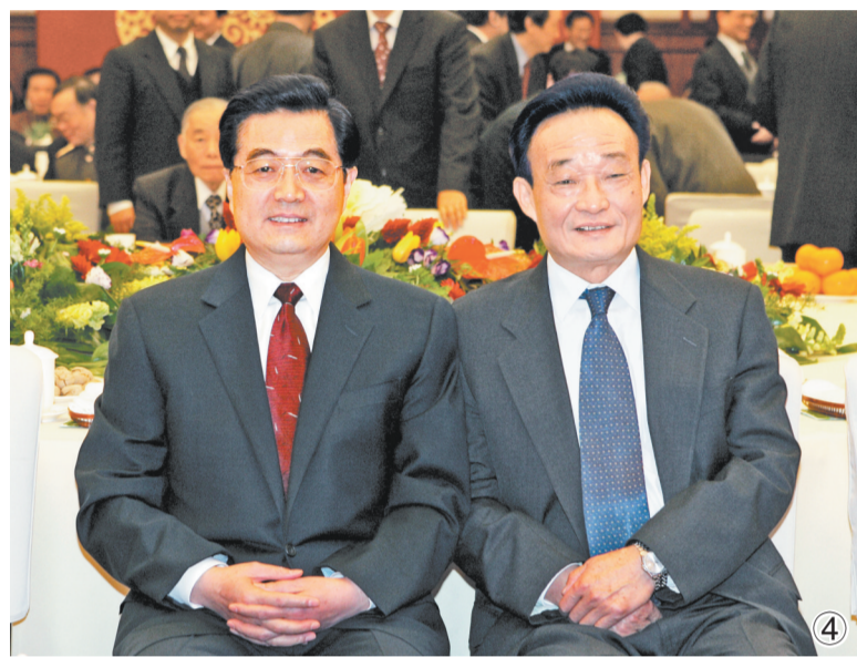
图④：二〇〇五年一月一日，全国政协在北京举行新年茶话会。这是胡锦涛同志与吴邦国同志在一起。