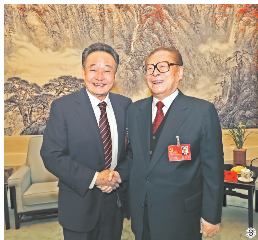
图③：2012年11月14日，中国共产党第十八次全国代表大会在北京闭幕。这是闭幕会前，江泽民同志与吴邦国同志在一起。