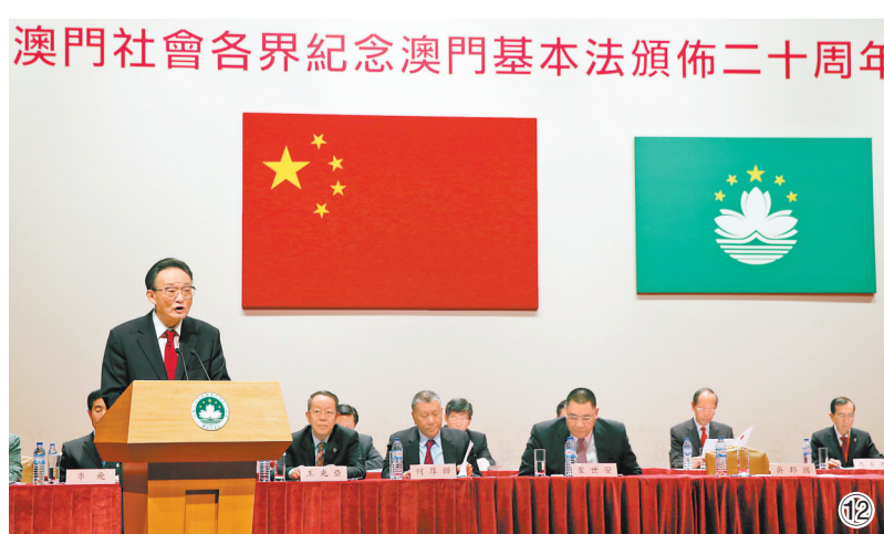
图⑫：2013年2月21日，吴邦国同志在澳门文化中心出席澳门社会各界纪念澳门基本法颁布20周年启动大会并发表讲话。