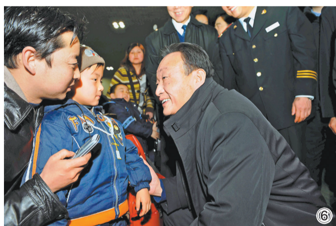
图⑥：2008年2月3日，吴邦国同志在北京西站候车室与旅客交谈。