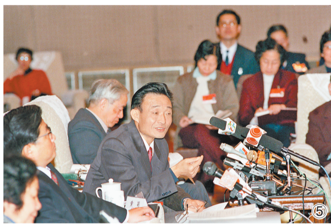
图⑤：1994年3月，时任上海市委书记的吴邦国同志在全国两会上海代表团全团会议上。

吴邦国同志是中国特色社会主义民主法治建设的重要领导者。他强调，如果没有比较完备的、高质量的法律法规，就谈不上实现社会主义民主政治的制度化、规范化和程序化，就谈不上依法治国、建设社会主义法治国家。在党中央领导下，他将立法工作作为全国人大及其常委会的首要任务，紧紧围绕党中央确定的立法工作目标，坚持科学立法、民主立法，适应社会主义市场经济发展、社会全面进步和加入世贸组织的新形势，把中国特色社会主义法律体系中基本的、急用的、条件成熟的法律作为立法重点，抓紧制定修改相关法律，集中开展法律清理工作。2003年3月，他担任中央宪法修改小组组长，在中央政治局常委会领导下主持宪法修改工作。由十届全国人大二次会议通过的宪法修正案，确立了“三个代表”重要思想在国家政治和社会生活中的指导地位，明确国家尊重和保障人权、依法保护公民的私有财产和继承权等内容，对促进我国经济社会发展、推进中国特色社会主义民主法治建设具有重要意义。在他的主持下，第十届、十一届全国人大及其常委会共审议通过宪法修正案草案、法律草案、法律解释草案和有关法律问题的决定草案186件，包括物权法、企业破产法、企业所得税法、公务员法、行政许可法、治安管理处罚法、劳动合同法、未成年人保护法、妇女权益保障法、关于加强网络信息保护的决定等。在党中央领导下，他主持制定反分裂国家法，把党和国家对台工作的大政方针和政策措施以法律形式固定下来，为反对和遏制“台独”分裂活动、促进祖国和平统一提供有力法律保障。他主持对香港特别行政区基本法、澳门特别行政区基本法及其附件有关条款作出解释并通过相关决定，推动两个基本法正确实施和“一国两制”方针贯彻落实。他主持制定修改一系列对中国特色社会主义事业发展具有重大影响的法律，为推动形成中国特色社会主义法律体系作出重要贡献。 (下转4版)