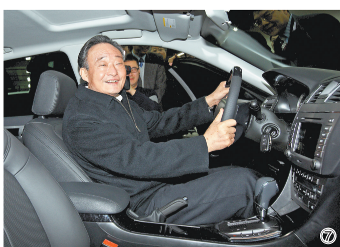
图⑦：2010年1月30日，吴邦国同志在上海汽车集团股份有限公司技术中心察看新能源样车。