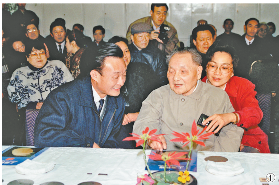
图①：1992年2月10日，邓小平同志在上海贝岭微电子制造有限公司参观时与吴邦国同志交谈。