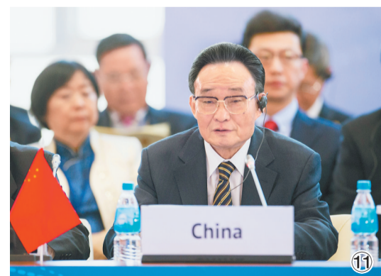
图⑪：2013年1月28日，吴邦国同志在俄罗斯符拉迪沃斯托克出席亚太会议论坛第21届年会，并作题为《坚持和平发展 促进合作共赢》的主旨发言。