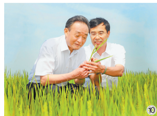
图⑩：2012年7月19日，吴邦国同志在黑龙江山垦建三江管理局二道河农场万亩大地号察看水稻长势。