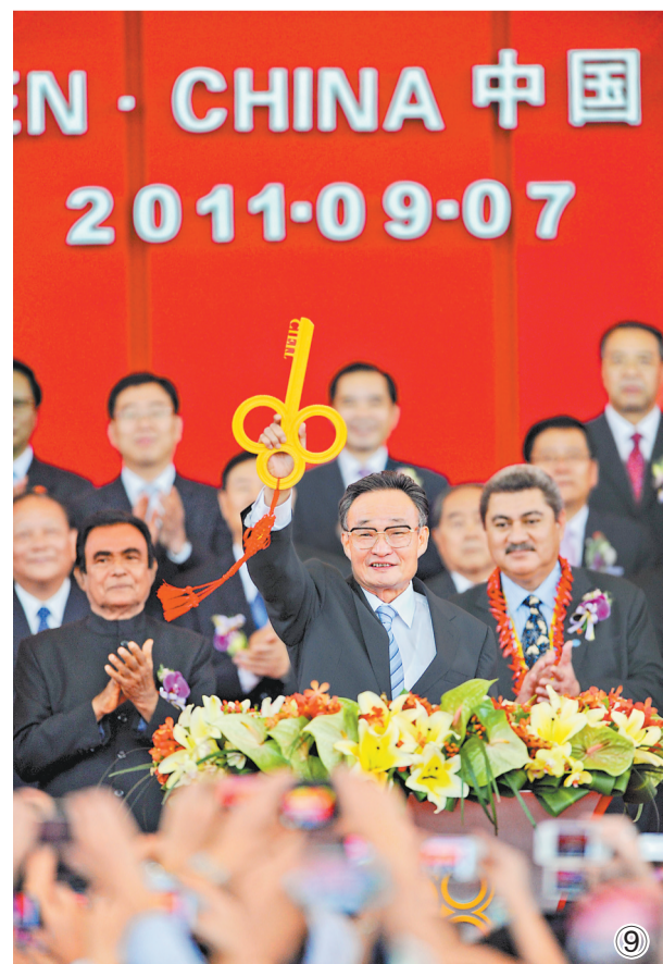
图⑨：二〇一一年九月七日，吴邦国同志在福建厦门出席第十五届中国国际投资贸易洽谈会开幕式。