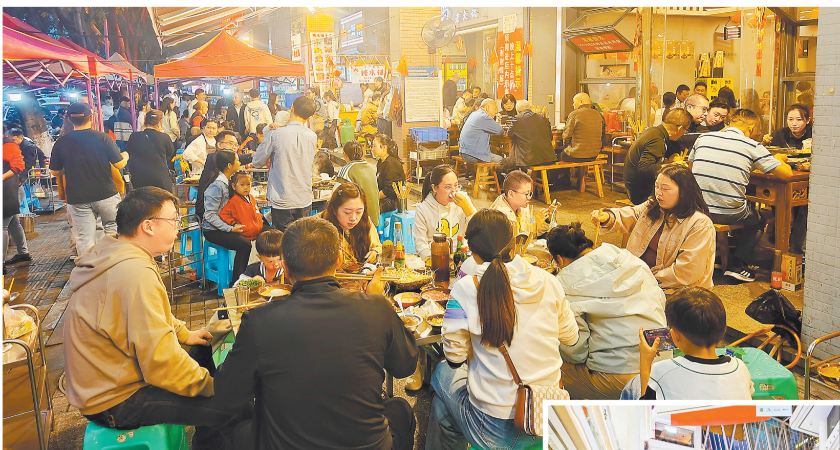
十月六日，渝北区北环“北环美食街”上坐满了前来吃火锅的游客和市民。