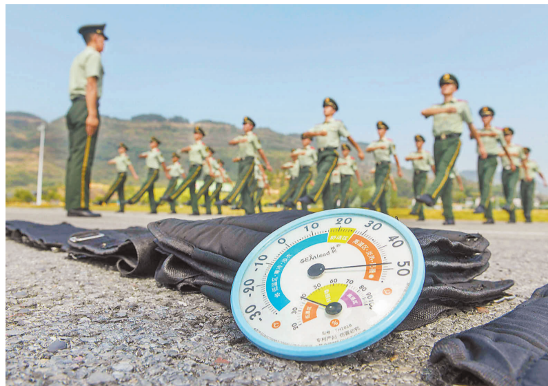
▼9月7日,队员们在高达50℃的户外高温下坚持进行正步踢腿摆臂练习。