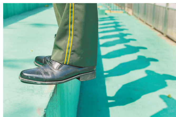
▲9月7日,队员在烈日下进行军姿训练。