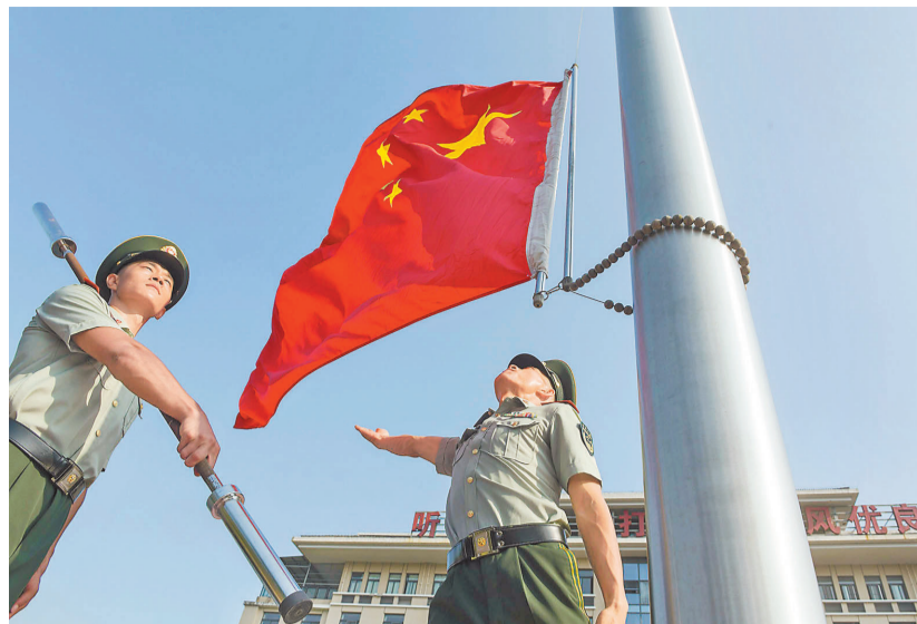
▼9月6日,旗手在反复进行徒手抛旗练习,负重10公斤杠铃杆的擎旗辅助练习。