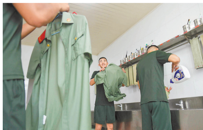
▲9月7日,武警重庆总队机动支队仪仗队营地,队员们正在洗衣服。天气炎热,他们一天要换好几次衣裤。