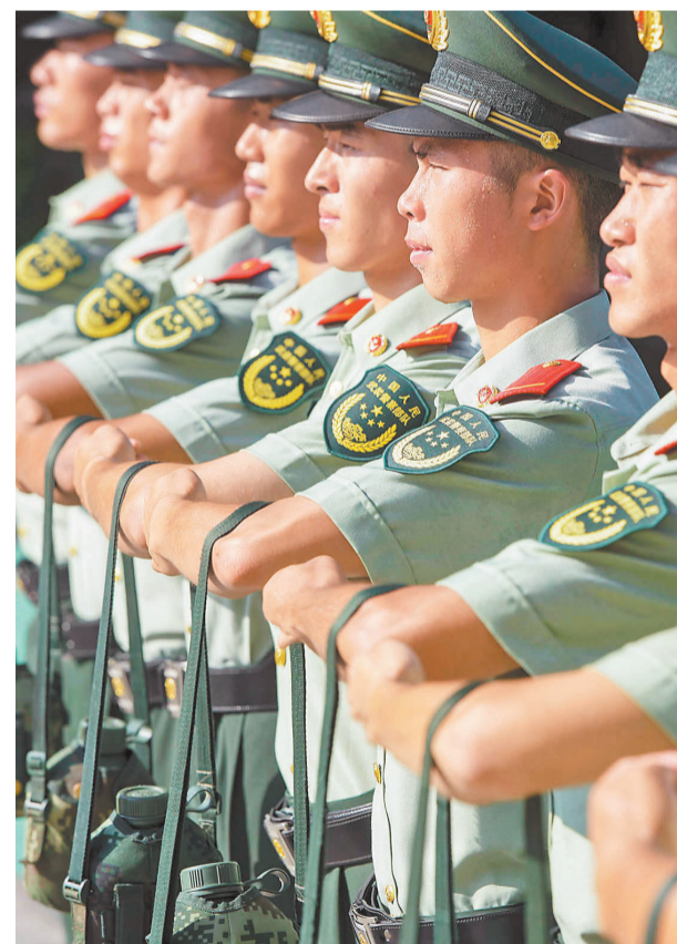
▲9月29日,武警重庆总队机动支队仪仗队营地,队员们领取了仪仗队礼服为执行升旗任务做准备。

采访接近尾声,完成降旗任务后,队员们扛着五星红旗,踏着整齐的步伐返回营区,夕阳西下,他们的影子在拉长,但他们的身躯始终如一地挺拔。