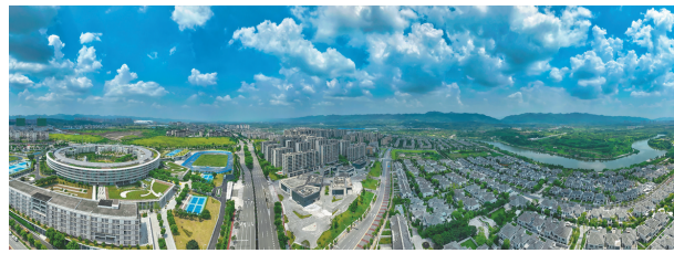
龙盛新城