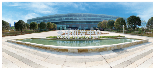
长安全球研发中心 摄/张义