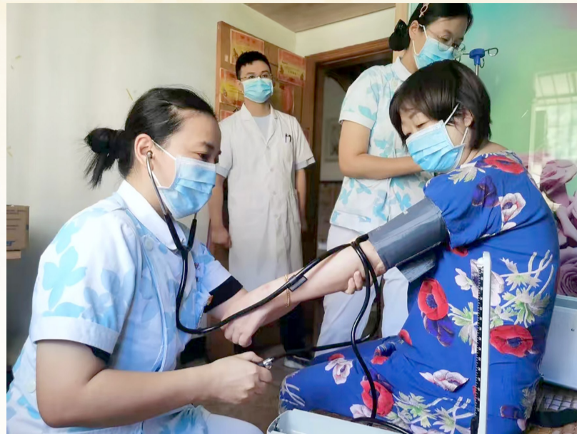
开展“互联网+护理”服务