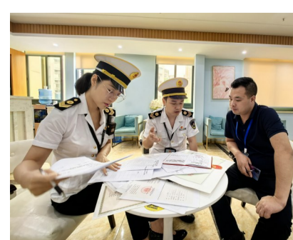
对辖区医疗机构进行监督检查

同时加强案件质量管理，行政执法水平提升明显，查办的非行医类辅助生殖案件、公共卫生违法案件分别获评川渝地区卫生健康行政执法典型案例、全市优秀案例和典型案例。1名执法人员凭借出色的办案能力、丰富的执法经验和扎实的理论功底，获评“全市卫生健康行政执法办案能手”殊荣。