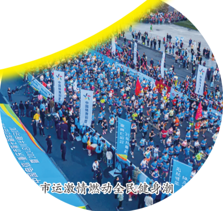
市运激情点燃全民健身热潮

体育健儿沙场点兵、勇攀高峰,广大市民拥抱市运、共享精彩,市七运会交出了一份完美答卷。