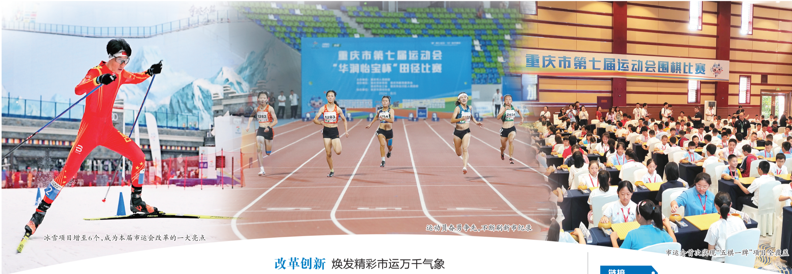
冰雪项目增至6个,成为本届市运会改革的一大亮点