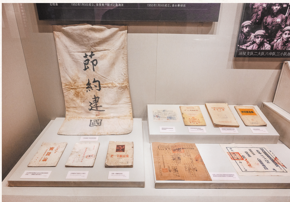
▲涪陵党史馆内陈列的有关西南服务团的展品。