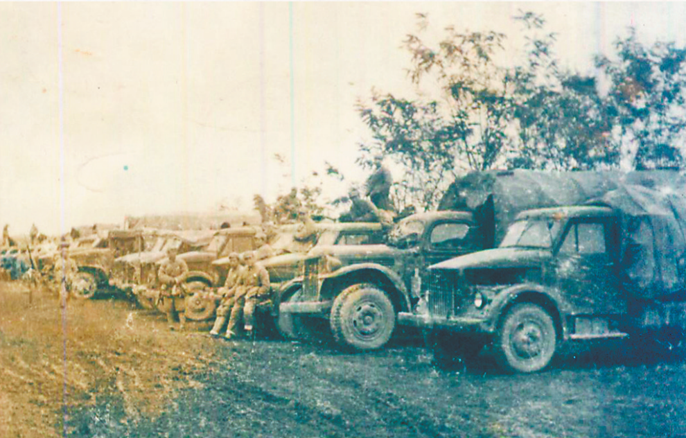
▲西南服务团进驻秀山机场。