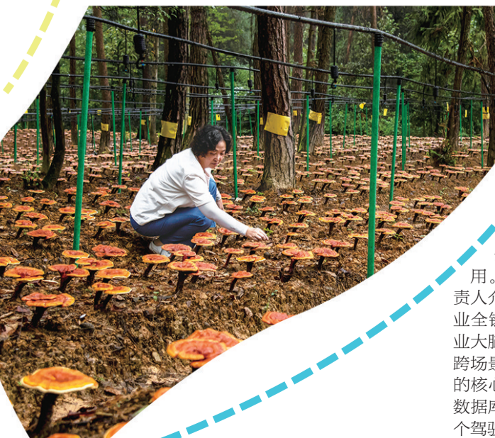
涪陵区大顺镇百坪村民在“灵芝”地里去除杂草