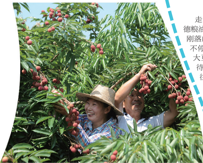
涪陵区南沱镇睦和村荔枝喜获丰收