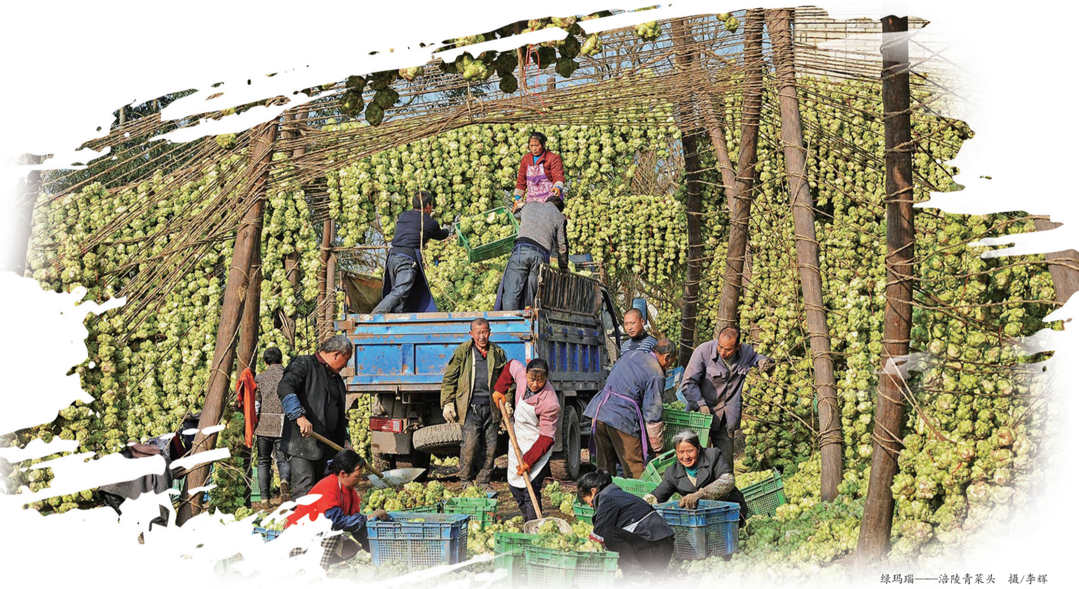
绿玛瑙——涪陵青菜头

截至去年底，全区农林牧渔业总产值达到146.03亿元，增长4.8%，第一产业增加值实现97.36亿元，稳居全市前列。带动农村常住居民人均可支配收入增长至22097元，同比增长6.5%，增幅居考核区第2位。