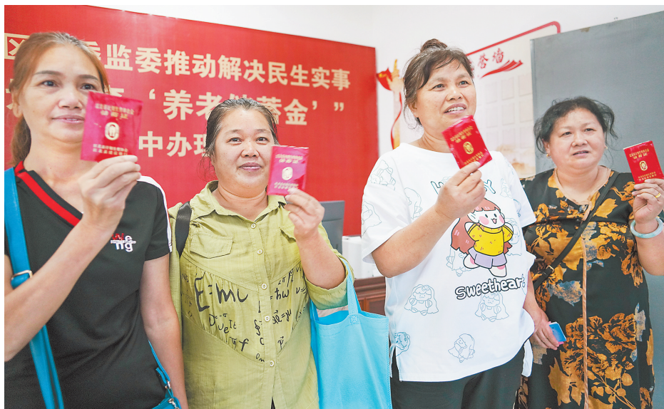
在江北区纪委监委的推动下，9月5日，“储蓄金”集中兑付会在复盛镇召开。

今年4月以来，南岸区纪委监委通过从信访举报中“摸”、审计和巡察报告中“找”、网络舆情中“搜”、码上举报中“挖”等方式，全面梳理群众反映的急难愁盼问题，逐一提出处置意见，形成建账对账销账闭环，推动解决村民用水难、危房改造、雨污混排、群众出行难等一批涉及面广、群众感知强的民生实事200余件，切实增强了群众幸福感、获得感，让人民群众感受到集中整治带来的新变化。