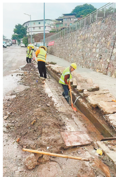
▲南岸区纪委监委在实地调研排水管网情况后，现场抓紧施工。