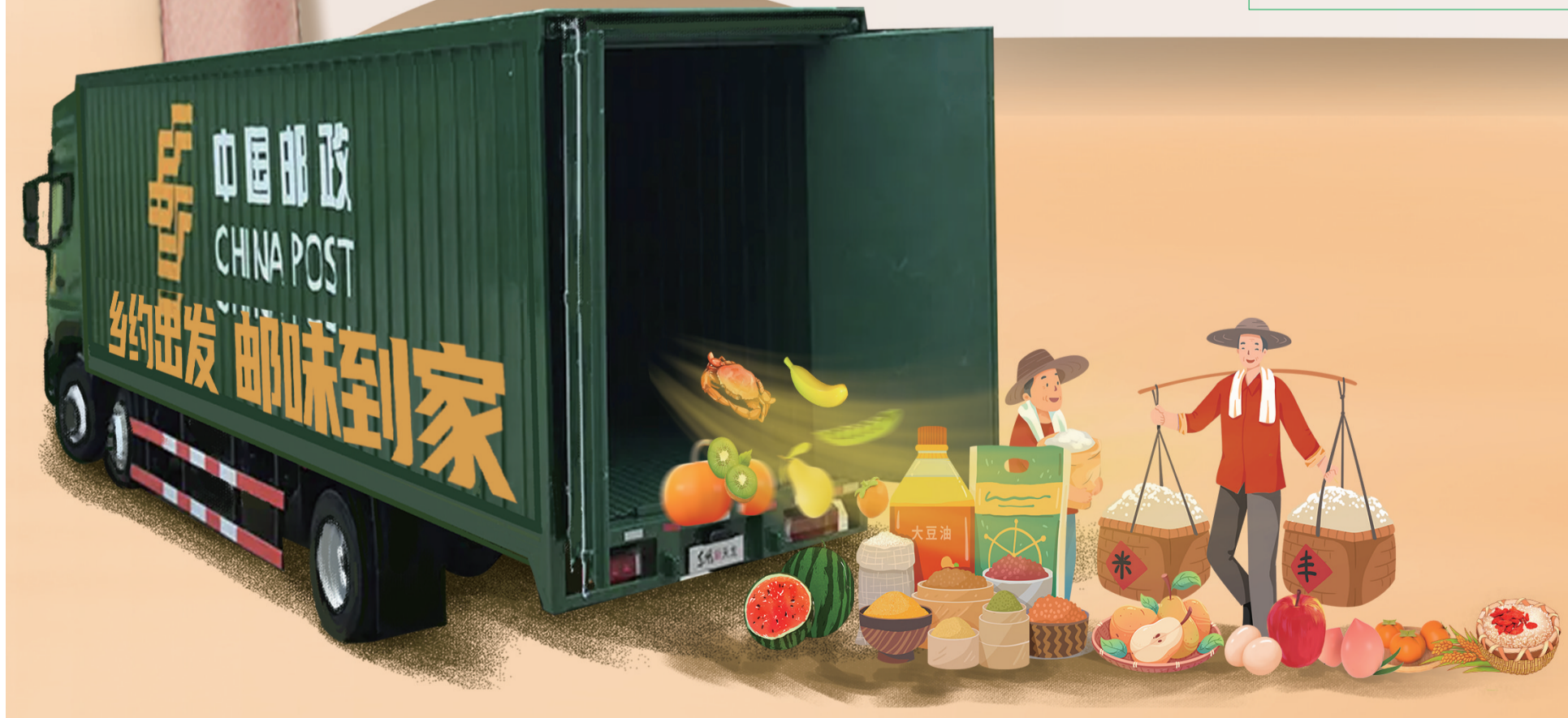
本版稿件由张亚飞、黄伟采写整理