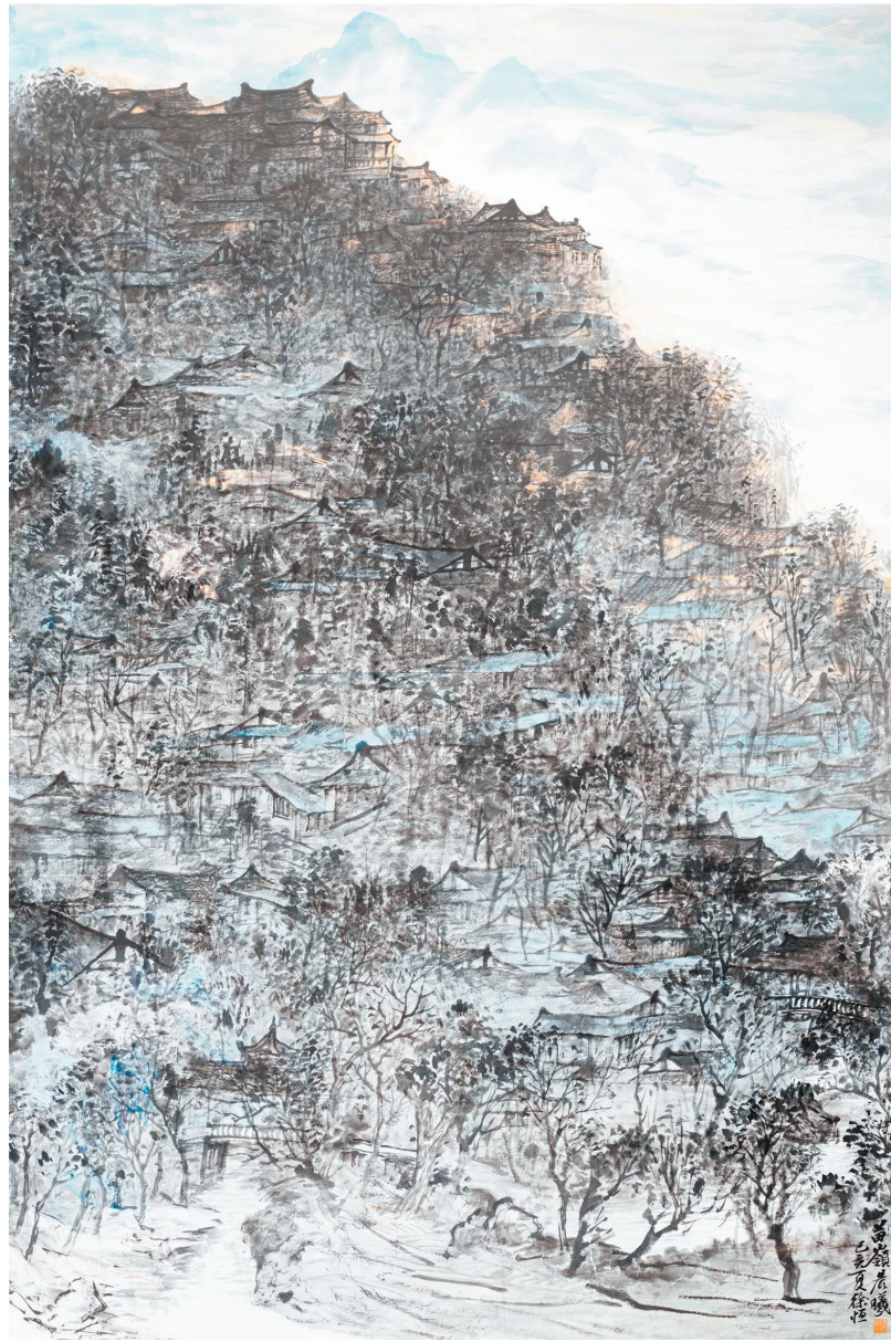
▲《苗岭晨曦》中国画 徐恒