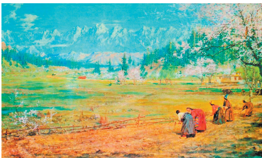
▲《春到西藏》董希文 布面油画