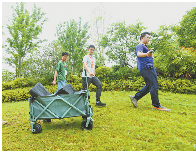
▲两江新区明月湖国际智能产业科创基地，致行科技科创团队在实地试验其研制的全球地形露营地运动运球车。（本报资料图片） 特约摄影 钟志兵/视觉重庆