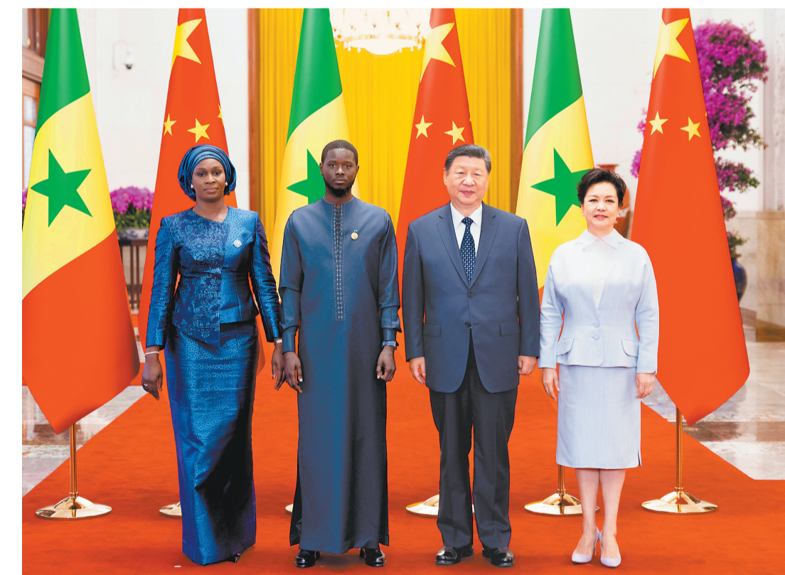
九月四日上午，国家主席习近平在北京人民大会堂同来华出席中非合作论坛北京峰会并进行国事访问的塞内加尔总统法耶举行会谈。会谈在人民大会堂北大厅为法耶总统法耶举行欢迎仪式。这是习近平和夫人彭丽媛同法耶和夫人玛丽合影。

法耶表示，我很荣幸来华进行首次国事访问并出席中非合作论坛北京峰会。感谢中方热情款待，使我们领略到中国的美丽与友好。塞中2016年建立全面战略合作伙伴关系以来，双方合作不断取得进展。塞中合作实施了很多成功项目，促进了塞内加尔经济发展和民生改善。塞方坚定恪守一个中国原则，反对将人权问题政治化，致力于同中方巩固深化塞中友谊，愿学习借鉴中方治党治国成功经验，推进农业、工业、数字化、职业培训、青年等领域合作，将塞中全面战略合作伙伴关系推向更高层次。中非合作论坛的建立发展基于友好信任、相互尊重、团结合作、务实高效，为非洲经济和社会发展作