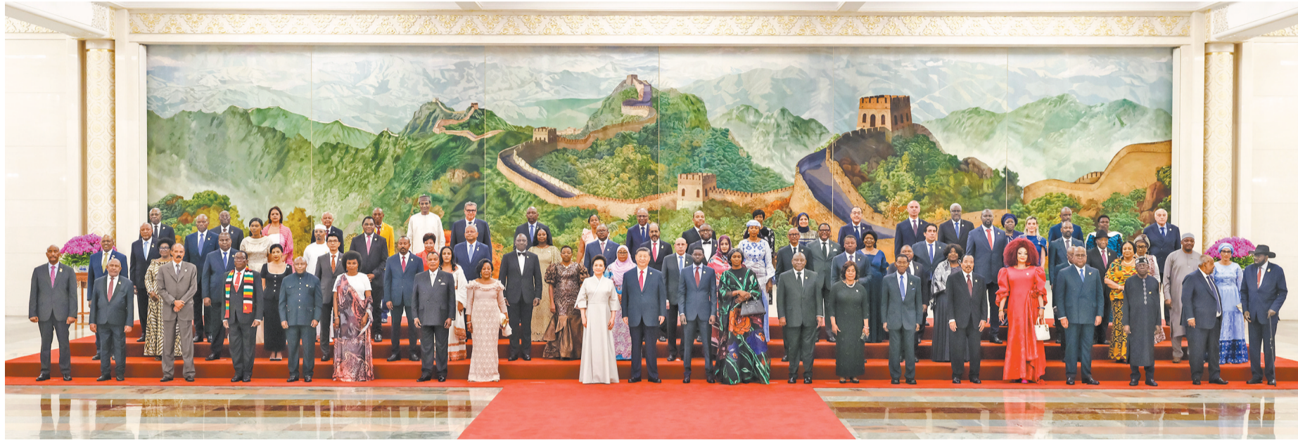
9月4日晚，国家主席习近平和夫人彭丽媛在北京人民大会堂举行宴会，欢迎来华出席中非合作论坛北京峰会的非方及国际贵宾。这是宴会前，习近平和彭丽媛同贵宾们集体合影留念。