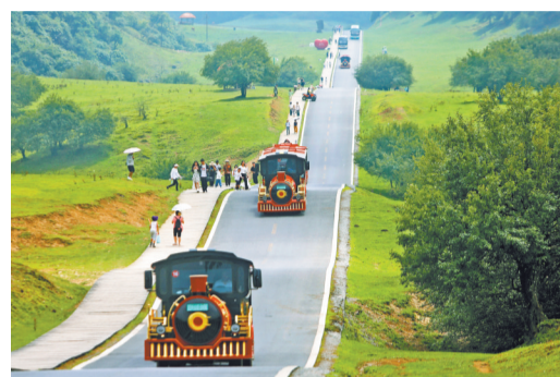
8月11日,武隆仙女山国家森林公园,旅游小火车载着游客行驶在“网红公路”上。连日来的高温天气,让高山避暑旅游持续火爆。