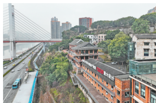
沙坪坝区沙滨路,原鸽牌电缆老厂房打造成的重庆大学设计创意产业园别具一格。(摄于2月20日)