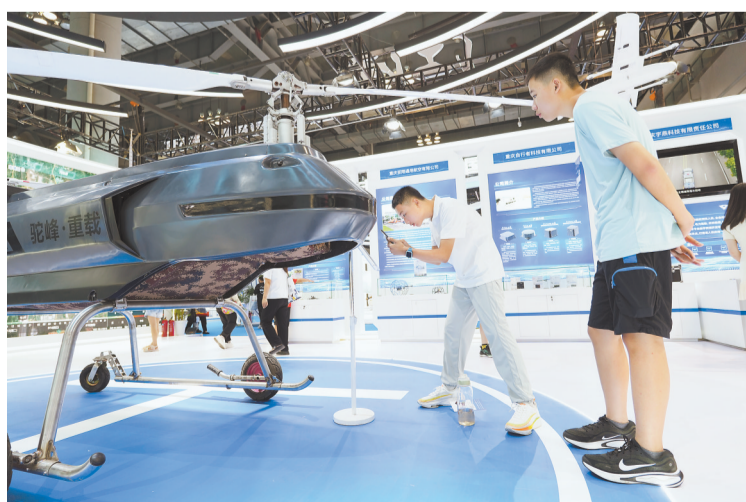
八月十四日，南坪会展中心，二〇二四中国航空航天科普展览会暨中国（重庆）低空经济产业博览会现场。