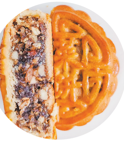
涪陵榨菜月饼即将上市。

两条石鱼栩栩如生，用金粉雕刻的字迹“白鹤梁水下博物馆”格外引人注目——记者看到，准备上市的榨菜月饼包装盒清新简约，巧妙融入了涪陵元素，透