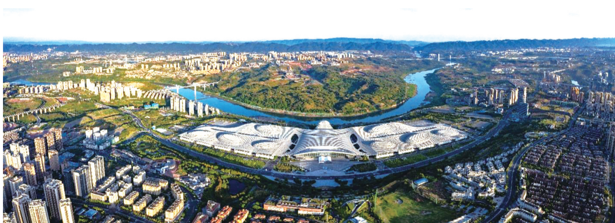
悦来国际会展城全景图

十多年来，重庆国博中心积极融入共建“一带一路”、长江经济带高质量发展和成渝地区双城经济圈建设，