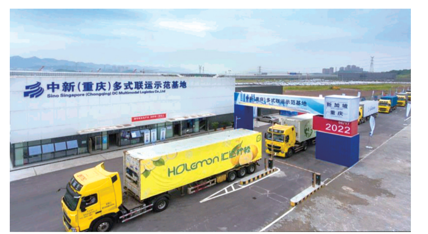
汇达柠檬搭乘中新(重庆)多式联运示范基地联运班车发往东南亚

如今，昔日的“舶来品”已化身“潼南柠檬”日渐走向全球，率先搭乘“一带一路”快车，填补中欧班列(渝新欧)生鲜空白。潼南柠檬及其加工产品远销俄罗斯、印尼、新加坡等30余个国家和地区。 而在潼南农投集团，每年有超5000吨的鲜果柠檬从这里发出，送达全国各地的水果连锁店。 “潼南柠檬品质好，在水果店很受市民群众的喜爱。”农投集团相关负责人表示。目前，农投集团还在与菜鸟农业、数字农业等公司开展合作，通过“一件代发”的模式，向全国各地发送鲜果柠檬50万单，并计划今年在湖北开设柠檬交易市场，持续提升柠檬品牌竞争力。 截至今年7月，该集团已为水果连锁店供应鲜果柠檬5500吨，销售额2560万元；为菜鸟农业、数字农业等公司“一件代发”鲜果柠檬110万单，销售额达820万元。 近年来，潼南区不断壮大柠檬出口市场主体，先后引进培育了一批有实力、有规模的柠檬出口企业