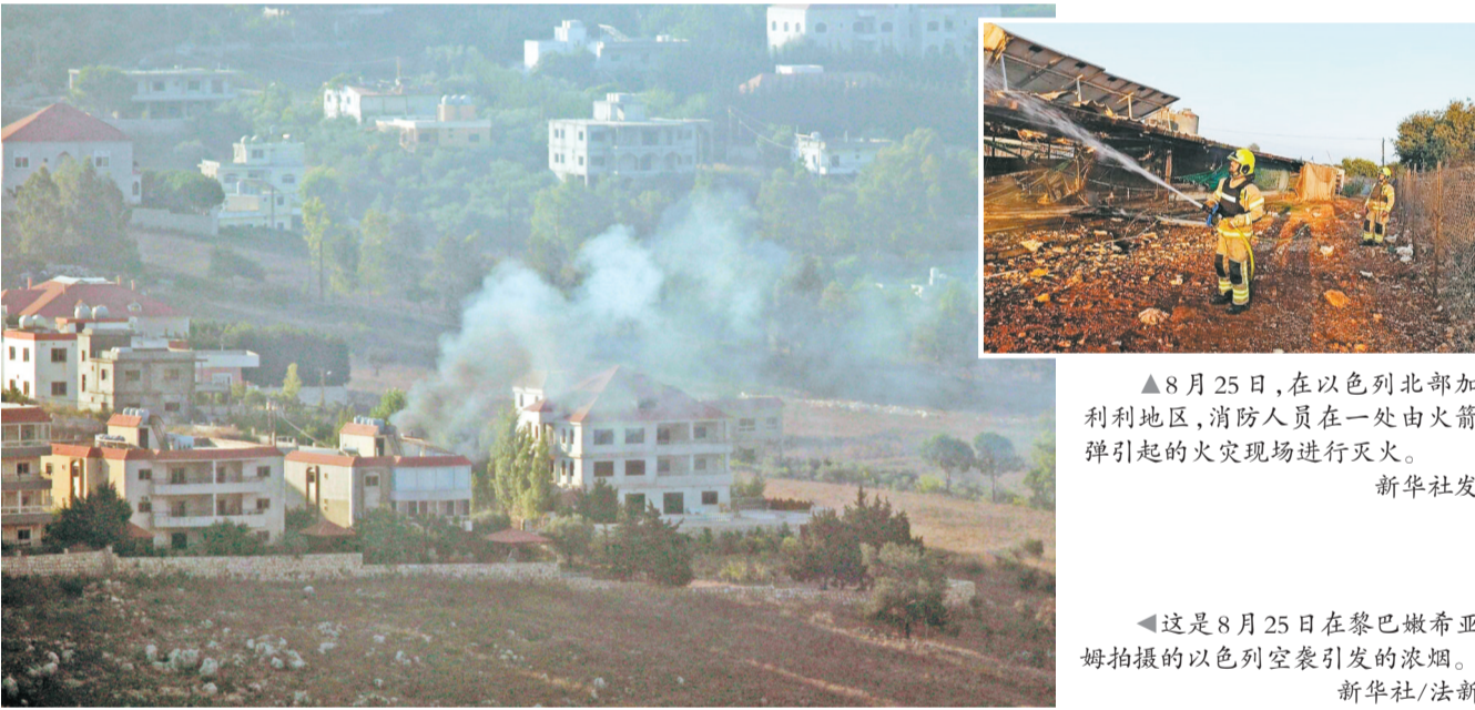
▲8月25日，在以色列北部加利利地区，消防人员在一处由火箭弹引起的火灾现场进行灭火。