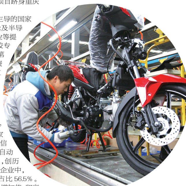
重庆大隆宇丰摩托车制造有限公司整车组装线