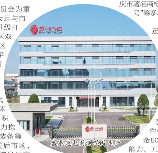
盛泰光电封装测试芯片生产

光电产业在大足也实现了长足发展。大足以盛泰光电为龙头，集聚佳禾光电、达汉电子等光电零配件生产企业6家，手机摄像头模组出货量全球第5位、全球市场占比6.5%，笔电摄像头模组出货量全球排名第2，主要供应华为、荣耀、华硕等主流企业，具备全球最薄模组(2毫米厚度)生产能力。