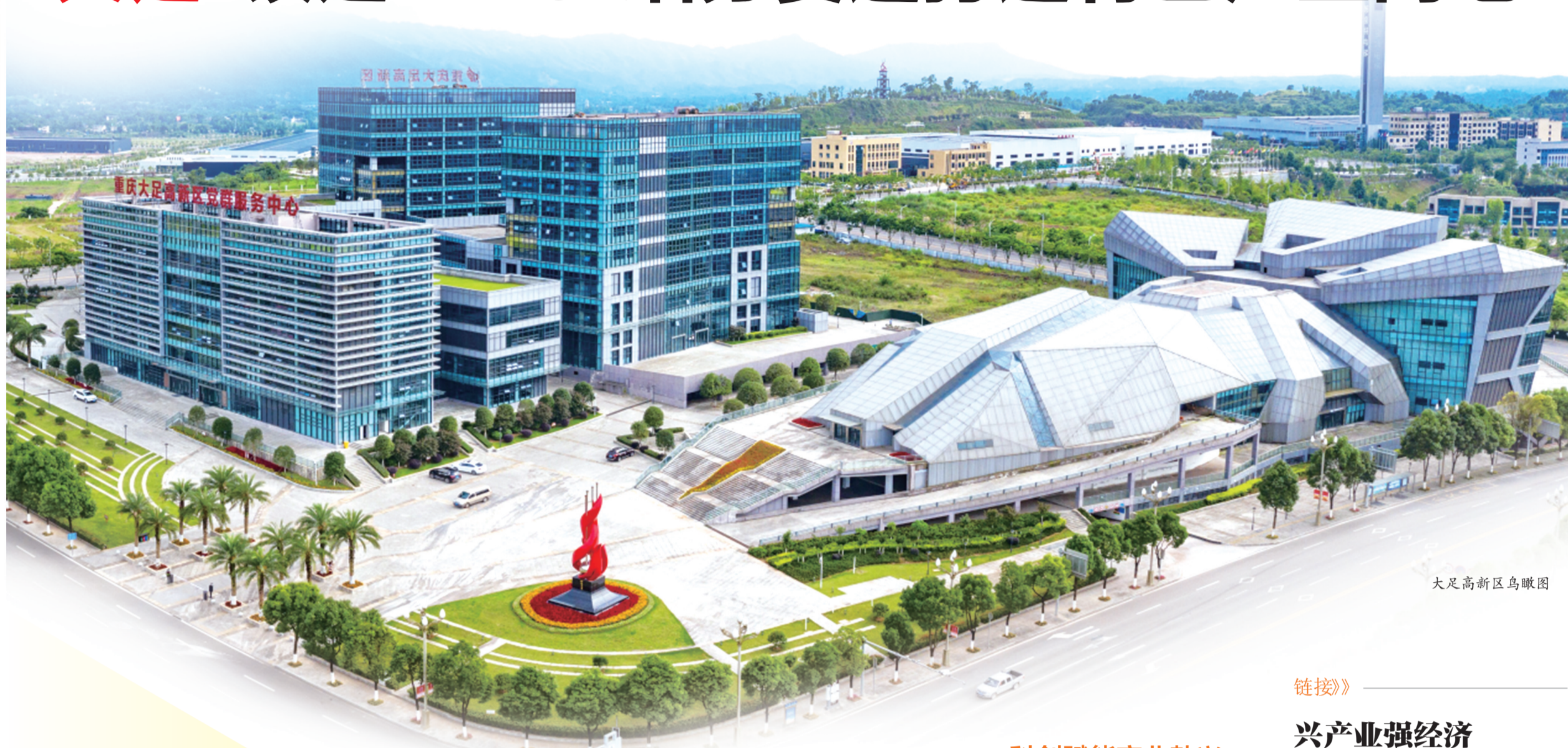
大足高新区鸟瞰图