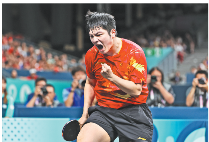
八月四日,樊振东在比赛中。

据新华社巴黎8月4日电(记者季嘉东 岳冉冉)4日,在巴黎奥运会乒乓球男单决赛中,樊振东以4:1击败瑞典选手特鲁斯·莫雷高德,夺得个人首枚奥运男单金牌,成为包揽世界杯、世乒赛、奥运会单打冠军的大满贯选手。