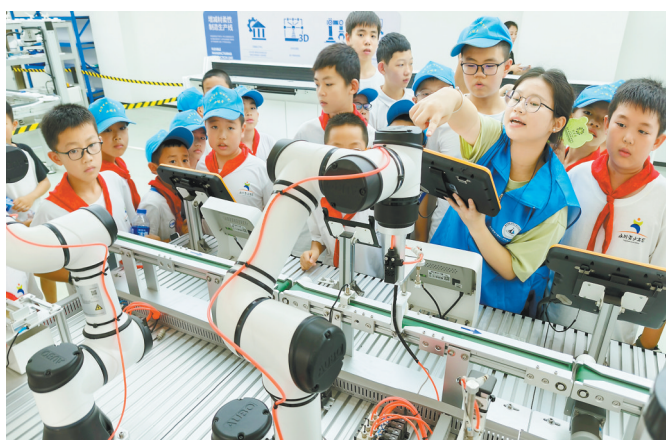
7月10日,江津双福重庆工程职业技术学院,孩子们了解智能设备相关知识。