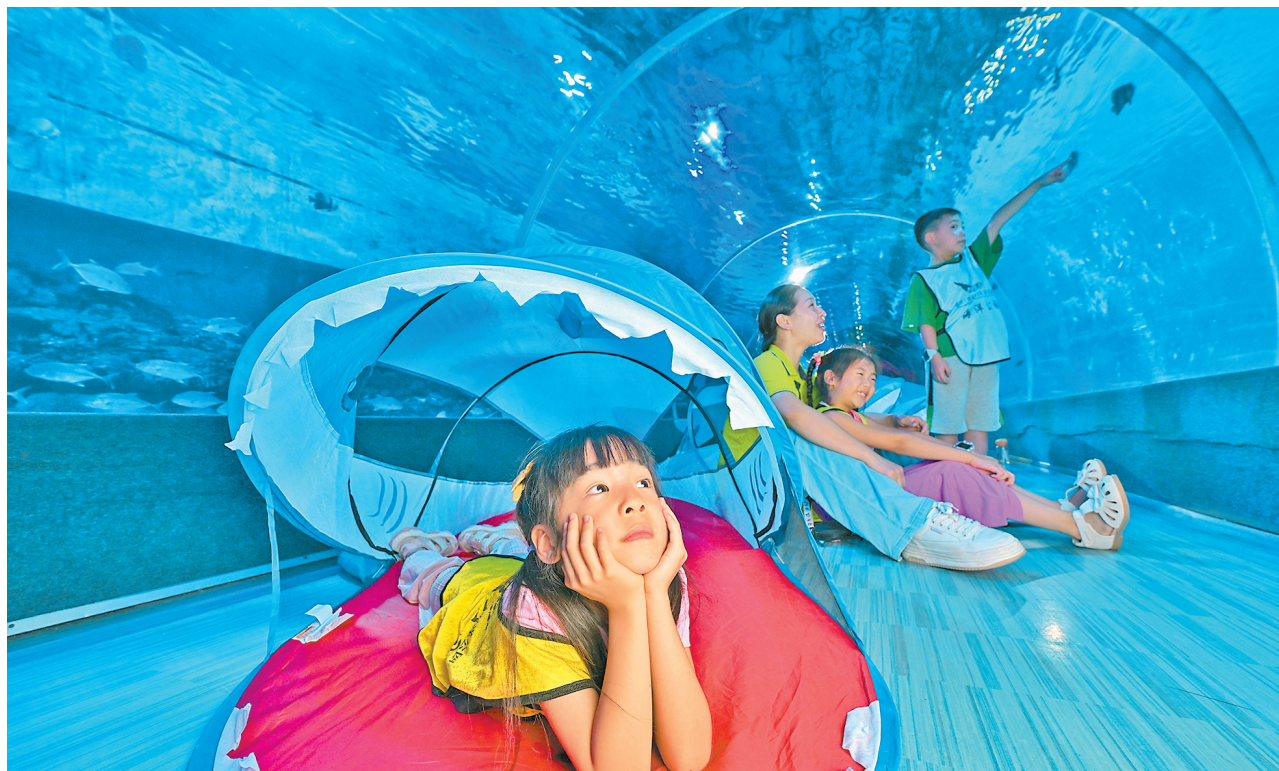
七月二十七日,重庆汉海海洋公园,孩子们在海洋馆潜水,探索海洋生物的奥秘。