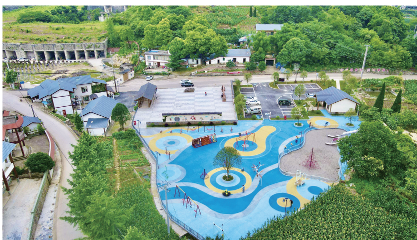
龙凤桥街道凤凰村人居环境整治

化乡村空间形态,北碚区还推动传统村落保护,涉农镇街开展村庄建设统计调查工作,实施美丽庭院建设和村庄亮化