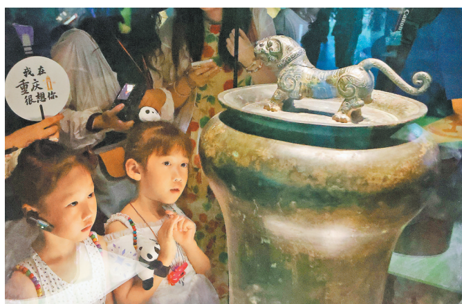
7月3日,重庆中国三峡博物馆,小朋友们正饶有兴趣地了解重庆颇具魅力的独特历史文化。