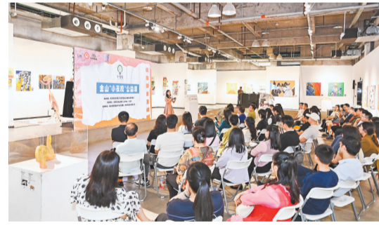
两江新区金山街道，社区学院“小夜校”大师公益课堂开课。(摄于4月27日)