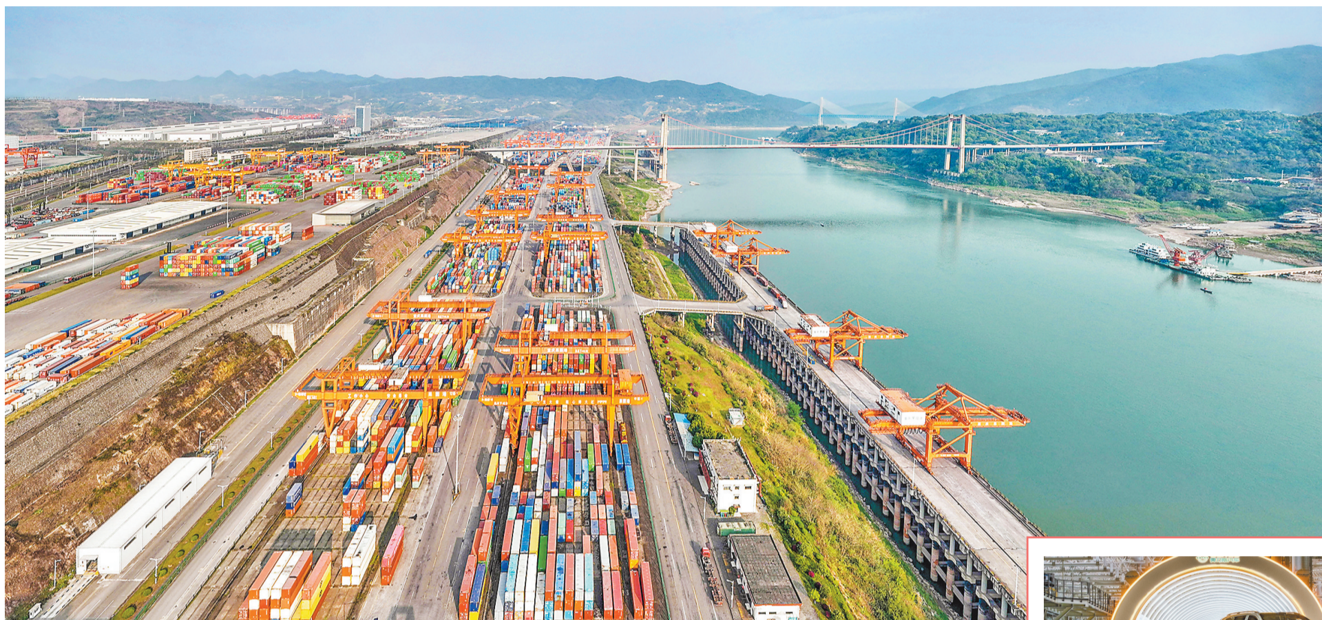
重庆果园港，集装箱码头在有序作业。果园港是西部唯一的港口型国家物流枢纽，以此为中心，两江新区统筹“铁公水空”多式联运，实现“全球买、全球卖”。(摄于五月五日)

秦淑斌介绍，重庆正加快建设内陆开放综合枢纽，两江新区围绕这一点，全力推进九大关键枢纽建设——