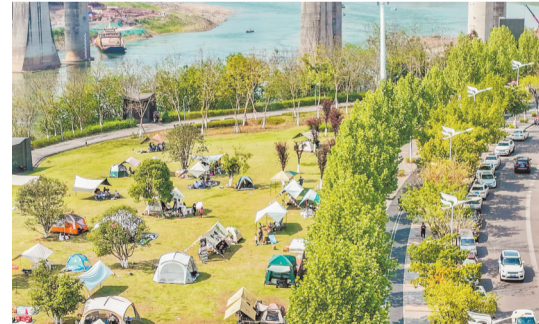
金海湾滨江公园内，众多市民在草地上搭起帐篷，享受休闲时光。(摄于4月16日)