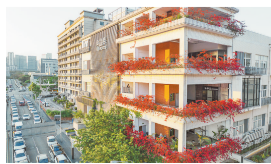
两江新区金山意库，盛开的三角梅将楼房装扮成一栋童话世界的建筑，吸引众多市民、游客前来打卡。(摄于4月26日)