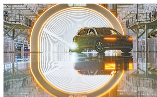
位于两江新区的赛力斯汽车超级工厂，又一辆新能源汽车驶出下线质量门。(摄于4月8日)

两江新区还有“全生命周期”的人才服务体系。目前，新区正加快打造重庆现代制造业人才创新创业服务港，为人才提供专业化、定制式服务。