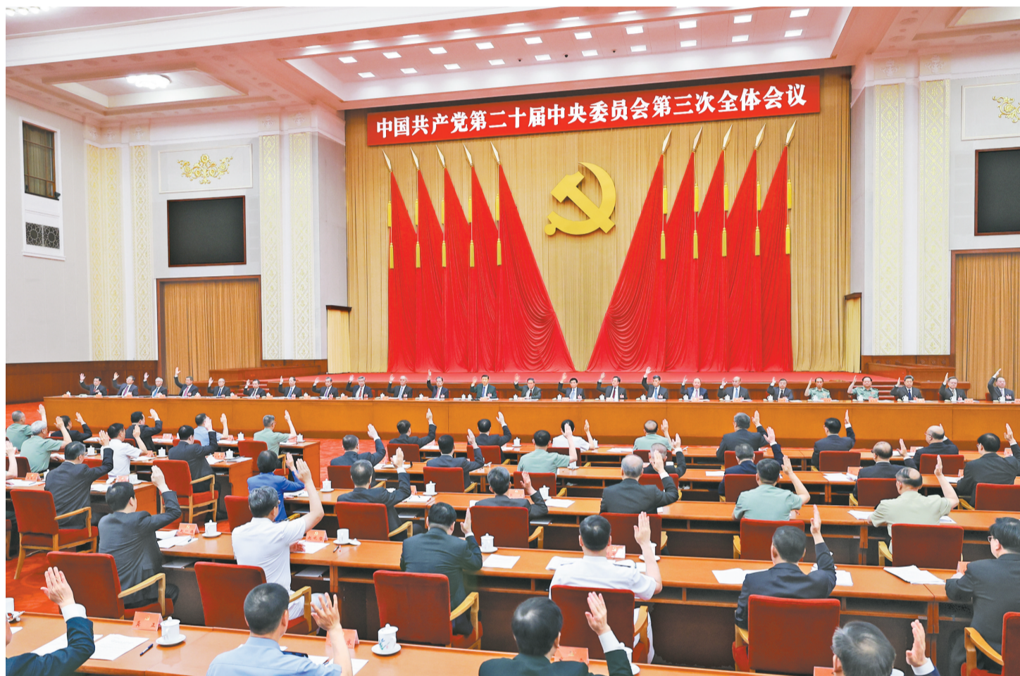
中国共产党第二十届中央委员会第三次全体会议，于2024年7月15日至18日在北京举行。中央政治局主持会议。