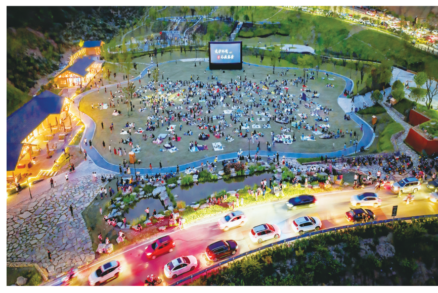
月亮谷之夜