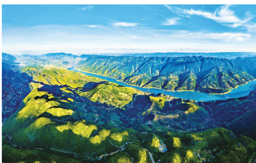
长江画卷尽收摩天岭

云上生活,爱尚巫山。文旅融合正不断赋能巫山提升旅游品牌形象、知名度和美誉度,巫山县相关负责人介绍,该县立足加快建成世界级知名旅游目的地,积极打造“旅游名县”,迭代升级文旅金字招牌、消费爆款和旅游体验,巫山得天独厚的文化旅游资源和区域优势正源源不断转化为引流出圈和经济发展优势。