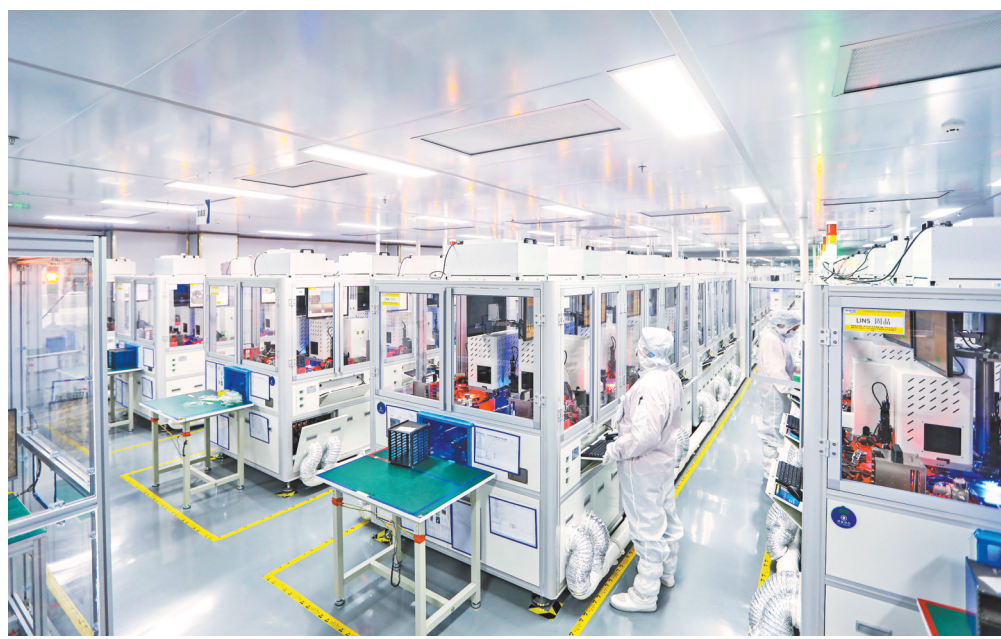
綦江高新区精简机构，清晰界定权责关系，实现轻装上阵。图为位于綦江高新区的重庆新视通智能科技有限公司二期数字化、千级无尘净化生产车间。

数据显示，此前，重庆38个区县设有406个产业类园区开发区。然而，这些园区开发区大多“小散弱”、管理机构冗杂。