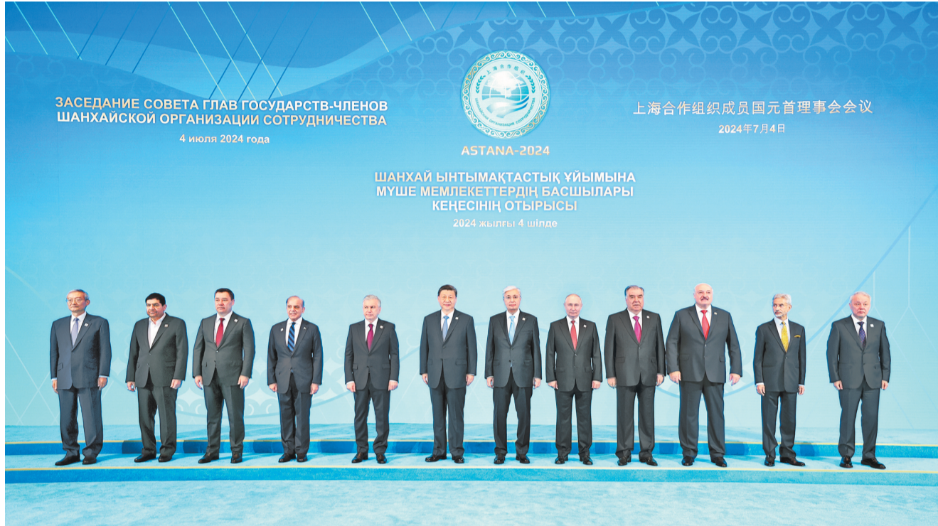
当地时间七月四日上午，国家主席习近平在阿斯塔纳独立宫出席上海合作组织成员国元首理事会第二十四次会议。