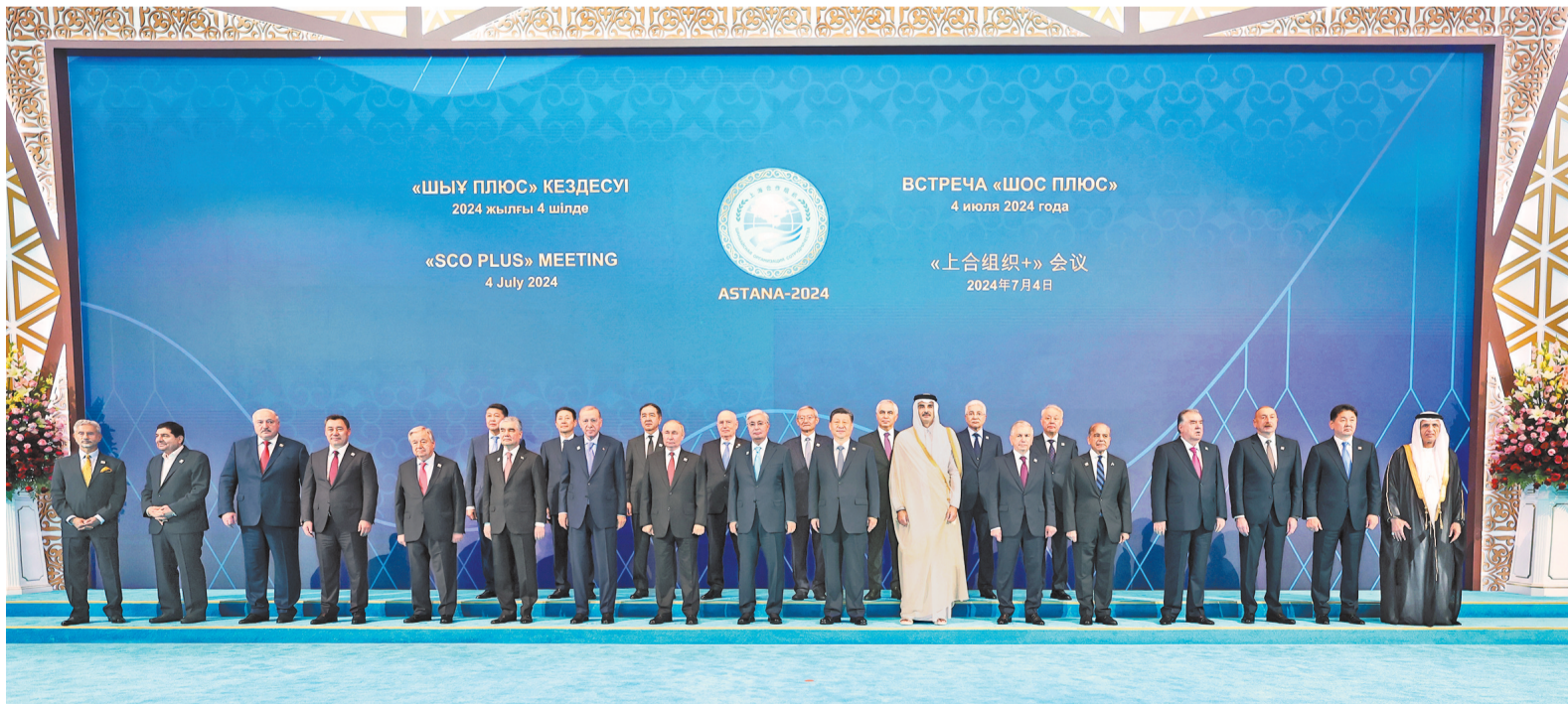
当地时间7月4日下午，国家主席习近平在阿斯塔纳出席“上海合作组织+”阿斯塔纳峰会并发表题为《携手构建更加美好的上海合作组织家园》的重要讲话。峰会开始前，习近平出席托卡耶夫与与会代表团团长举行的欢迎宴会并集体合影。

新华社阿斯塔纳7月4日电（记者 孙浩 黄河 张继业）当地时间7月4日下午，国家主席习近平在阿斯塔纳出席“上海合作组织+”阿斯塔纳峰会并发表题为《携手构建更加美好的上海合作组织家园》的重要讲话。