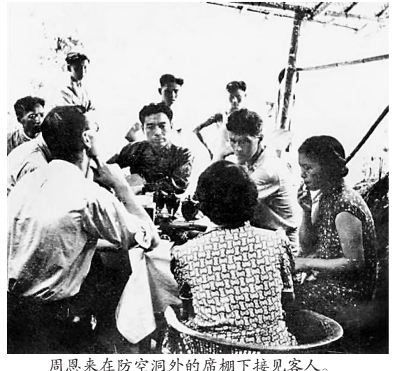
周恩来在防空洞外的席棚下接见客人。