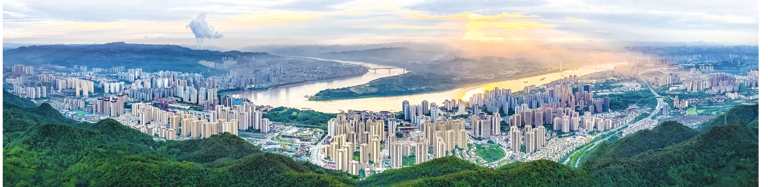
大美新巴南

截至目前,巴南区已建成11个市级智能工厂、48个市级数字化车间,智能制造标杆企业4家、双化协同示范工厂2家、灯塔工厂揭榜企业2家。