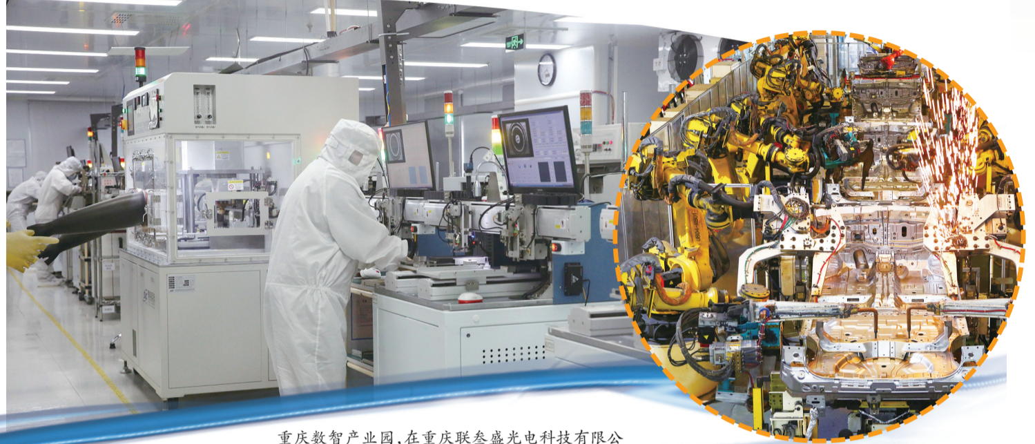
重庆数智产业园,在重庆联泰盛光电科技有限公司生产车间,工人正在生产线上忙碌