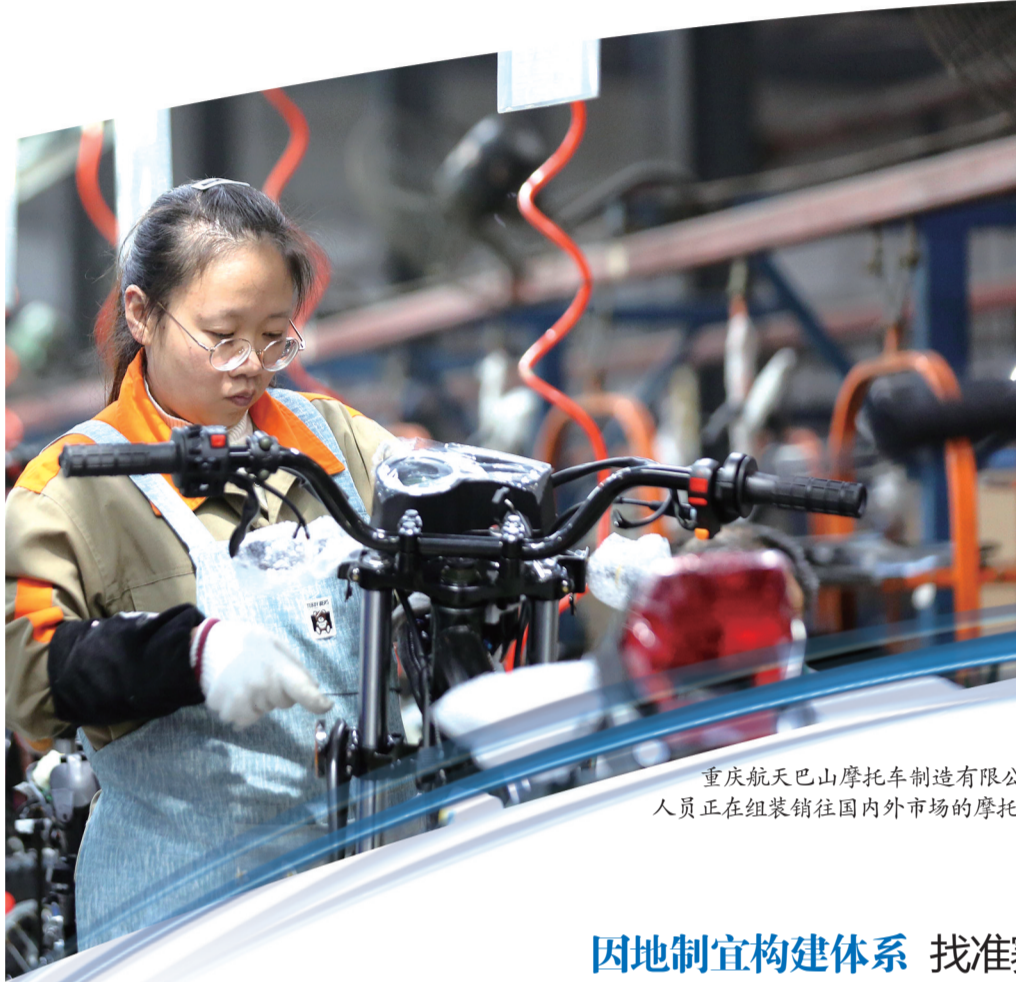
重庆航天巴山摩托车制造有限公司,生产技术人员正在组装销往国内外市场的摩托车

2024年一季度,巴南区工业占GDP比重达到32.9%,对GDP增长贡献率为38.6%。巴南区成功上榜全市招商综合实效、制造业招商、现代服务业招商3个榜单。近年来,巴南区在市委、市政府的坚强领导下,深入推进工业高质量发展,坚定不移实施“工业强区”战略,积极融入全市“33618”现代制造业集群体系的同时,因地制宜构建“1246”制造业集群体系,工业经济“换道超车”取得明显成效。