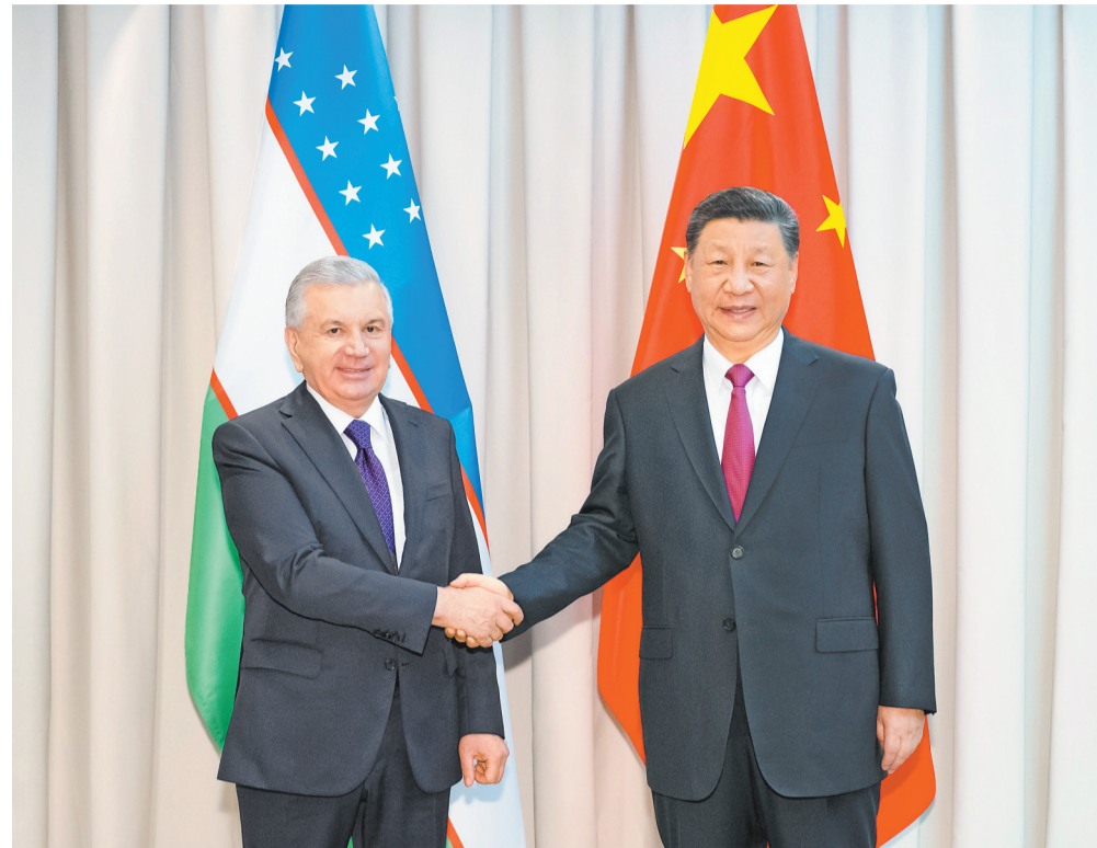
当地时间7月3日下午,国家主席习近平在阿斯塔纳出席上海合作组织峰会前会见乌兹别克斯坦总统米尔济约耶夫。