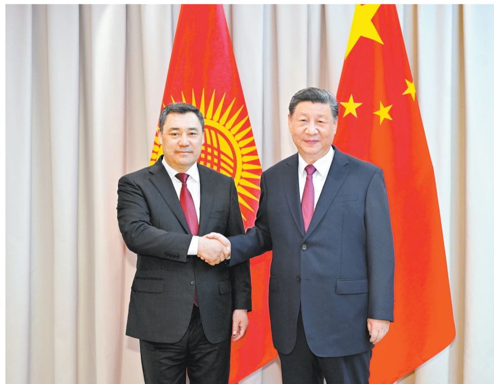
当地时间7月3日下午,国家主席习近平在阿斯塔纳出席上海合作组织峰会前会见吉尔吉斯斯坦总统扎帕罗夫。