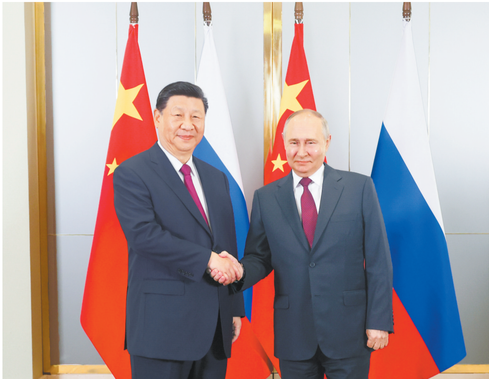
当地时间7月3日晚,国家主席习近平在阿斯塔纳出席上海合作组织峰会前会见俄罗斯总统普京。