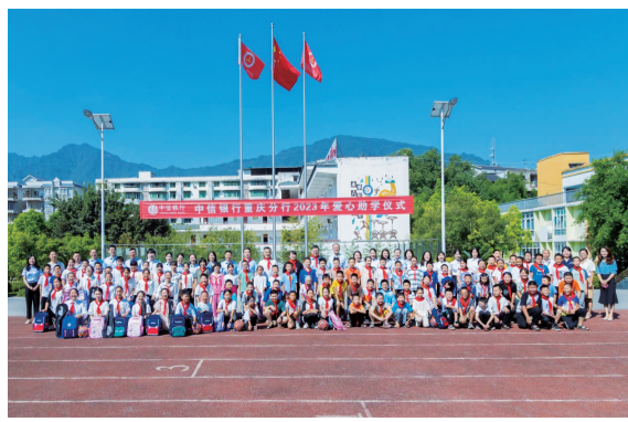
中信银行重庆分行连续13年开展爱心助学