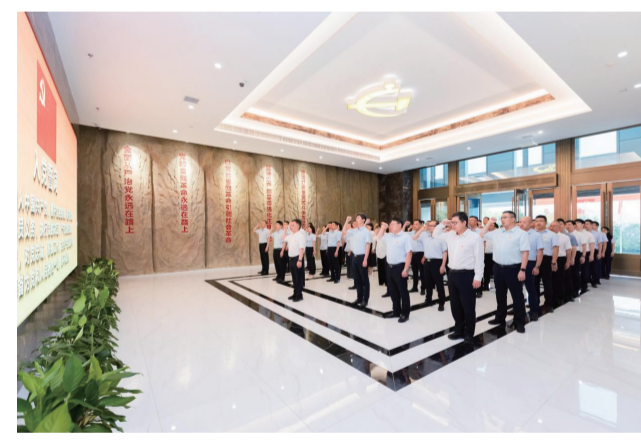
7月1日，中信银行重庆分行党委书记带领班子成员及各支部书记参观市党风廉政教育基地并重温入党誓词

着力加强党的组织建设，建强战斗堡垒。该行深入贯彻落实《关于中管金融单位党组织书记抓基层党建述职评议考核实施办法（试行）》《关于严格中管金融单位党的组织生活制度若干规定（试行）》等通知要求，注重严格规范，压实主体责任，将每个基层党组织都锻造成为坚强战斗堡垒。深入运用“四联四促”工作法，经营机构与管理部门党支部结对共建，分支联动、合力攻坚克难；锚定