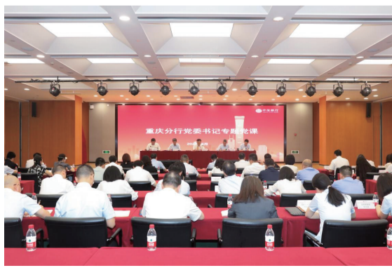
中信银行重庆分行开展党委书记讲专题党课