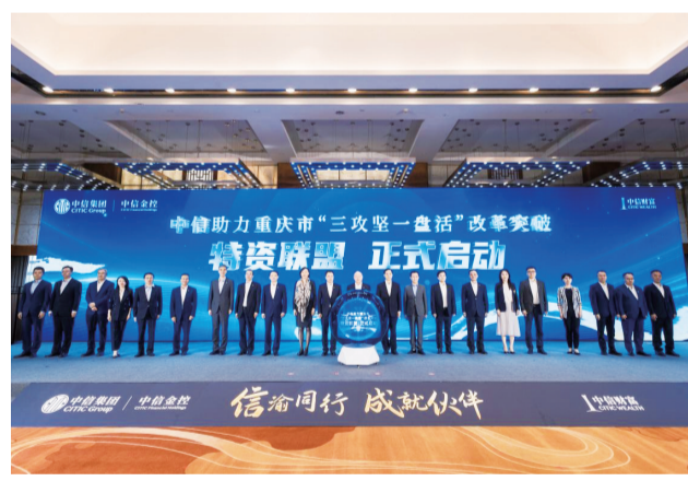
中信助力重庆市“三攻坚一盘活”改革突破专场联合路演暨特资联盟启动仪式

重点客户、重大项目、重要平台，组建“强核尖兵·党员先锋队”；开展党员“三问三亮六带头”，动员广大党员在完成重大任务、应对重大挑战、开展志愿服务中勇挑重担、争当先锋。2023年中信银行重庆渝中支行成功获评“银行业营业网点文明规范服务百佳示范单位”，以优质服务赢得客户信赖；南坪支行党支部成立党员先锋队，服务民营企业170多户；投行和托管联合党支部组建攻坚克难小组，落地多项科创金融投资联动项目，推动当地科创金融发展……充分发挥基层党组织战斗堡垒作用和党员先锋模范作用，推动党建工作与业务发展深度融合。