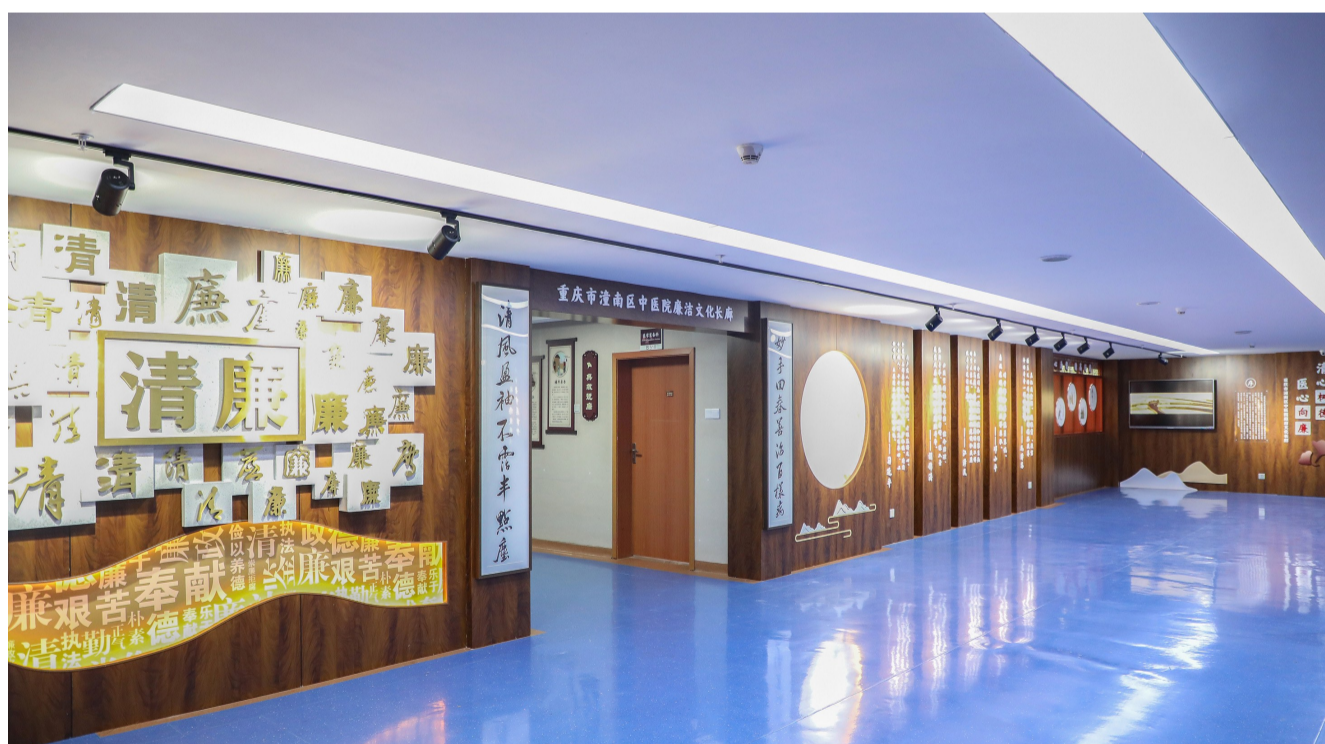
医院清廉文化长廊

在党建统领下,医院党建品牌文化持续为高质量发展塑形铸魂,先后荣获重庆市美丽医院、重庆市科普基地、重庆