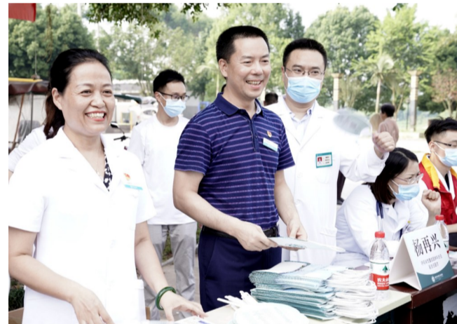
医院医生在义诊中服务基层群众

设“1669”总体布局,坚持压实党委主体责任,纪委监督责任、支部落实责任三方合力,积极推动清廉思想、清廉制度、清廉纪律、清廉文化建设融入医院发展的各领域、全过程,为卫生事业高质量发展注入“廉”动力。