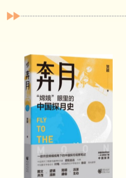
《奔月》 (重庆出版社 出版)