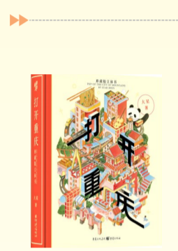
《打开重庆:珍藏版立体书》 (重庆出版社 出版)