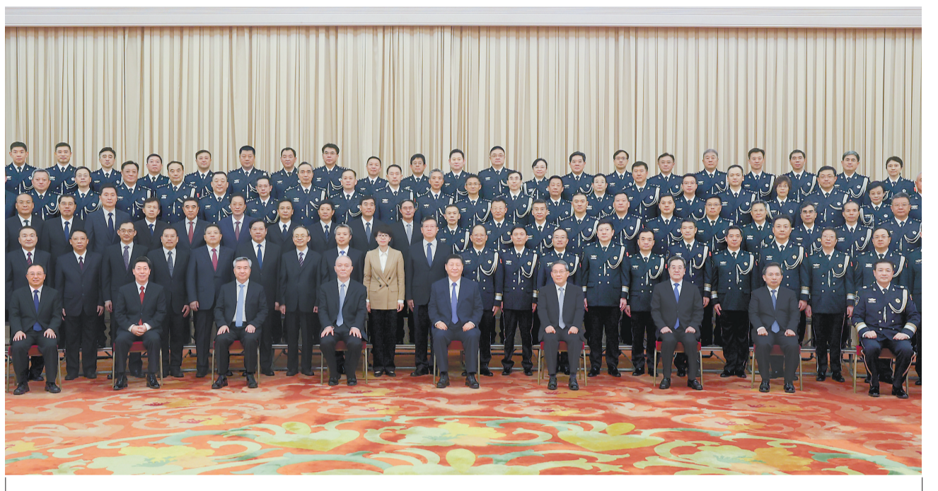
5月28日，党和国家领导人习近平、李强、蔡奇、丁薛祥、李希等在北京人民大会堂会见全国公安工作会议代表。

新华社北京5月29日电 中共中央总书记、国家主席、中央军委主席习近平28日下午在北京人民大会堂亲切会见全国公安工作会议代表，向他们致以诚挚问候，勉励全国广大公安民警辅警奋力推进公安工作现代化，为推进强国建设、民族复兴伟业作出新的更大贡献。 中共中央政治局常委李强、蔡奇、丁薛祥、李希参加会见。 下午4时，习近平等来到人民大会堂西大厅，全场响起热烈掌声。习近平等走到代表们中间，同大家亲切握手，不时交谈，并合影留念。 陈文清参加会见并在29日上午召开的全国公安工作会议上讲话。他指出，要坚持以习近平新时代中国特色社会主义思想为指导，全面贯彻习近平法治思想、总体国家安全观，深入学习贯彻习近平总书记关于新时代公安工作的重要论述，牢牢把握新征程公安工作的前进方向；全面加强党的政治建设，着力锻造忠诚干净担当的过硬公安铁军；忠诚履行职责使命，全力以赴走到代表们中间，同大家亲切握手，不时交谈，并合影留念。 陈文清参加会见并在29日上午召开的全国公安工作会议上讲话。他指出，要坚持以习近平新时代中国特色社会主义思想为指导，全面贯彻习近平法治思想、总体国家安全观，深入学习贯彻习近平总书记关于新时代公安工作的重要论述，牢牢把握新征程公安工作的前进方向；全面加强党的政治建设，着力锻造忠诚干净担当的过硬公安铁军；忠诚履行职责使命，全力以赴走到代表们中间，同大家亲切握手，不时交谈，并合影留念。