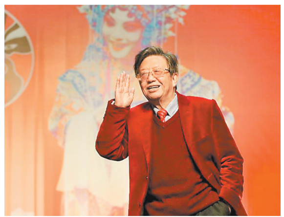
2018年,魏明伦来渝话川剧发展。(资料图片)

改革开放40周年川剧艺术巡礼”系列活动。“我至今还留着当年重庆川剧院排演我的《巴山秀才》剧照。”当时,他饶有兴致地回忆起与重庆川剧的不解情缘,同时也对重庆川剧的良好发展势头连连点赞,“重庆的川剧现在是发展壮大了,而且越来越好,一部《金子》就囊括了那么多大奖,了不起!我认