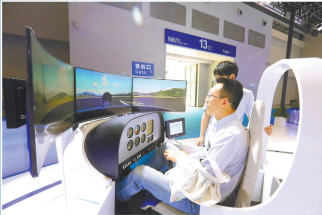
▲5月24日，西洽会展馆内，市民正在体验模拟飞行。随着低空经济的快速发展，人们对飞行的向往和需求正日益增长。