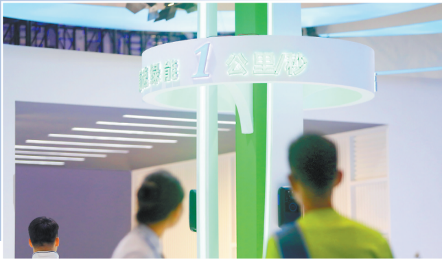
▲5月24日，西洽会展馆内，实现“1秒1公里”的超级充电桩亮相。市民驾驶电动汽车上高速，在超级充电桩充电10分钟可跑600公里。