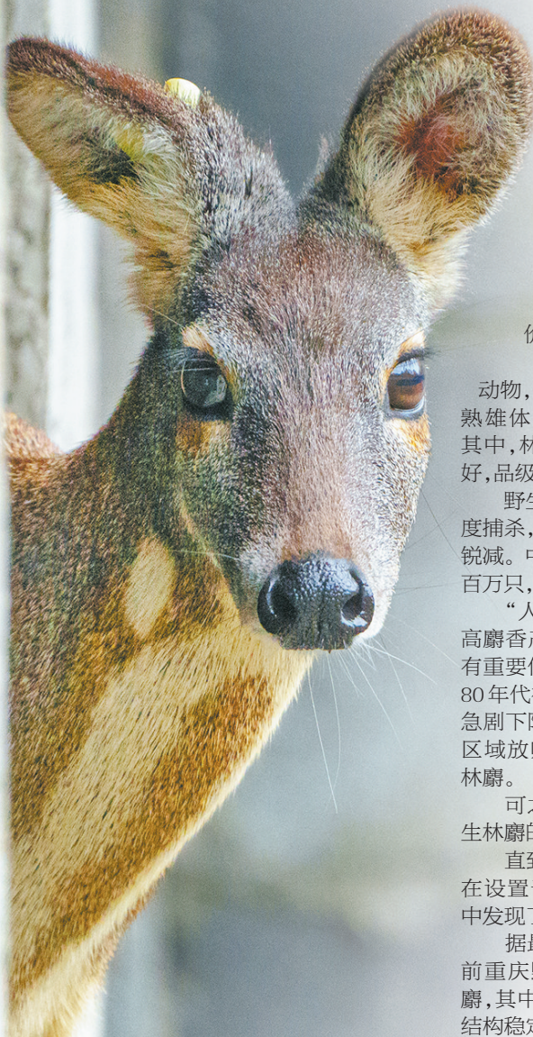
4月11日，重庆市药物种植研究所林麝繁育基地里的林麝。