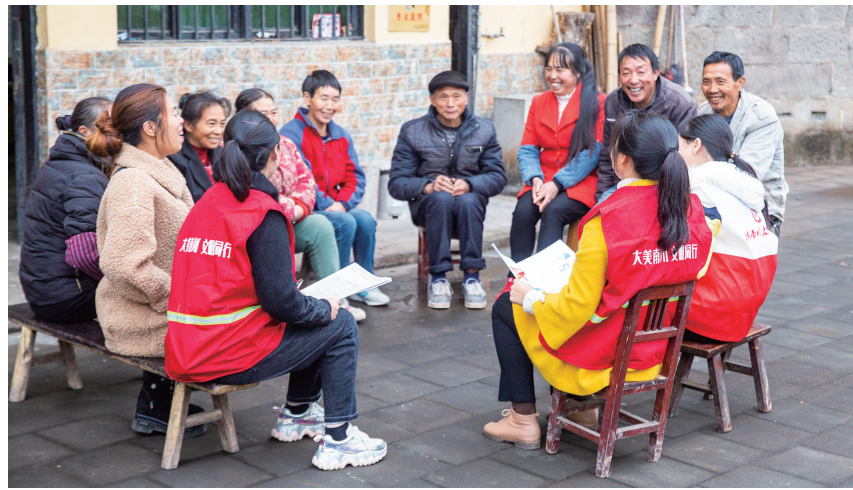
大观镇“荷仙姑”暖心志愿服务队进村入户宣传文明新风

4月17日，“春风满巴渝——风尚178·文明直通车”进基层活动在兴隆镇永福村举行。