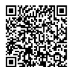
精彩视频 扫一扫 就看到

虽然方法各不相同，但如今全国的林麝人工繁育采取的都是活麝取香技术，这让麝香的提取生产再也不用以牺牲林麝生命为代价。