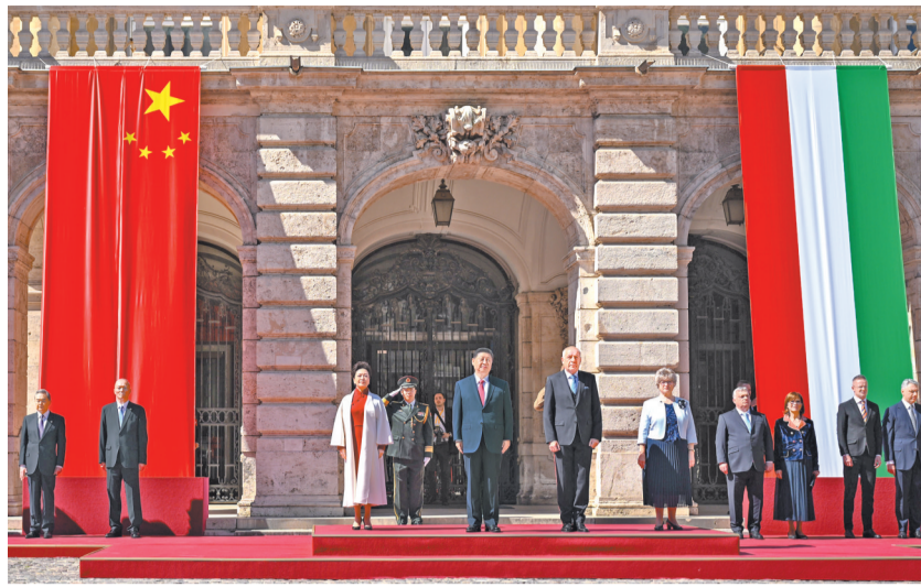
当地时间5月9日上午，国家主席习近平在布达佩斯出席匈牙利总统舒尤克和总理欧尔班共同举行的隆重欢迎仪式。