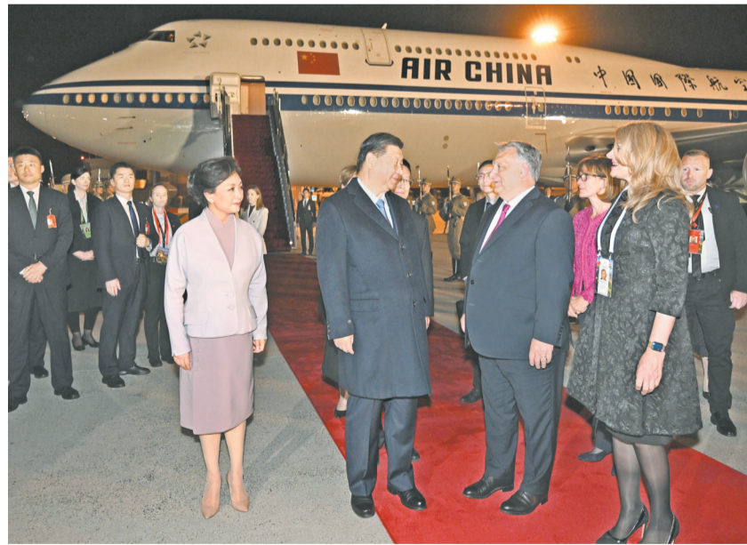
当地时间5月8日晚，国家主席习近平乘专机抵达布达佩斯，应匈牙利总统舒尤克和总理欧尔班邀请，对匈牙利进行国事访问。匈牙利总理欧尔班夫妇、外长西雅尔多等政府高级官员在机场热情迎接习近平和夫人彭丽媛。

习近平发表书面讲话。习近平指出，很高兴应舒尤克总统和欧尔班总理的盛情邀请，对美丽的匈牙利进行国事访问。中匈两国是相互信赖的好朋友、好伙伴。近年来，双方高层交往密切，互信水平不断提高，共建“一带一路”合作成果丰硕，人文交流丰富多彩，在国际和地区事务中紧密协调和配合，为相互尊重、公平正义、合作共赢的新型国际关系树立起一个典范。今年是中匈建交75周年，两国关系发展迎来重要契机。我期待着同舒尤克总统、欧尔班总理等匈方领导人会晤，共同规划两国合作发展新蓝图，引领中匈关系向着更高水平迈进。我相信，无论国际风云如何