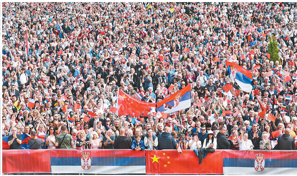
当地时间5月8日上午，国家主席习近平在贝尔格莱德塞尔维亚大厦同塞尔维亚总统武契奇举行会谈。会谈前，武契奇陪同习近平来到政府大厦平台（左图）。大厦广场上，一万五千名塞尔维亚民众挥舞中塞两国国旗，对习近平表示最热烈的欢迎（右图）。（拼版照片）