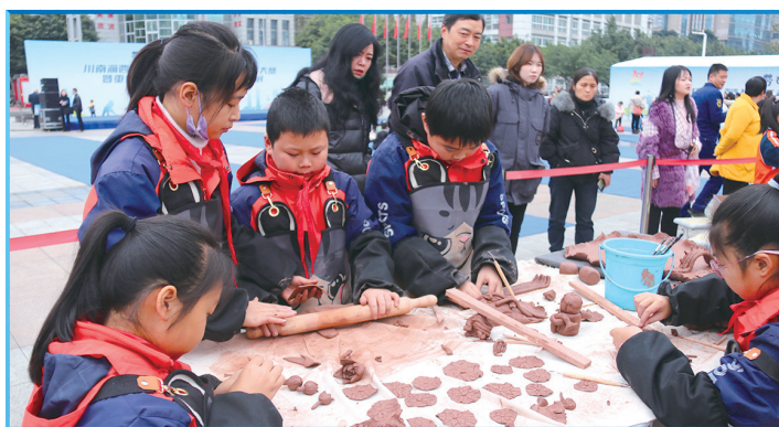
荣昌区举办首届中小学劳动教育成果展暨劳动技能大赛