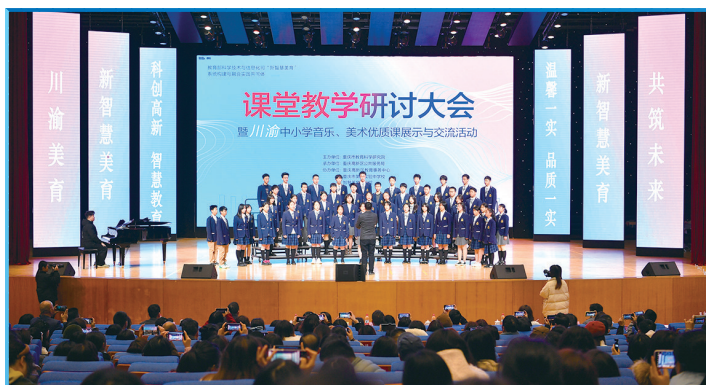
重庆高新区公共服务局承办川渝中小学音乐、美术优质课展示与交流活