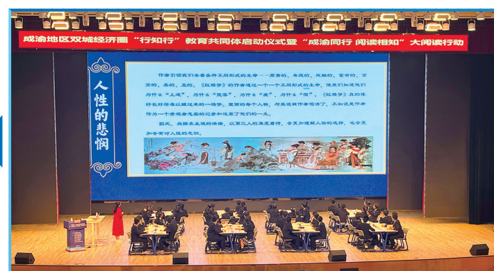
“成渝同行 阅读相知”大阅读行动活动在合川区举行