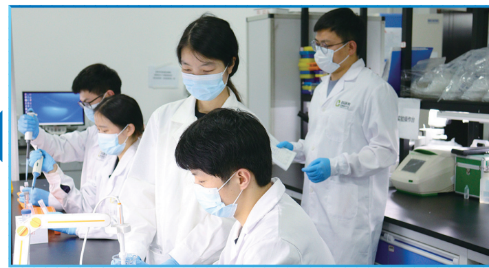
重庆理工大学创新细胞治疗师生团队在药物分析实验室开展“甜味+”特色食品研发工作