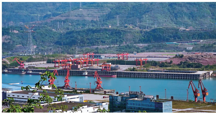
农发行重庆市分行积极支持西部陆海新通道建设，推动重庆加快打造内陆开放高地