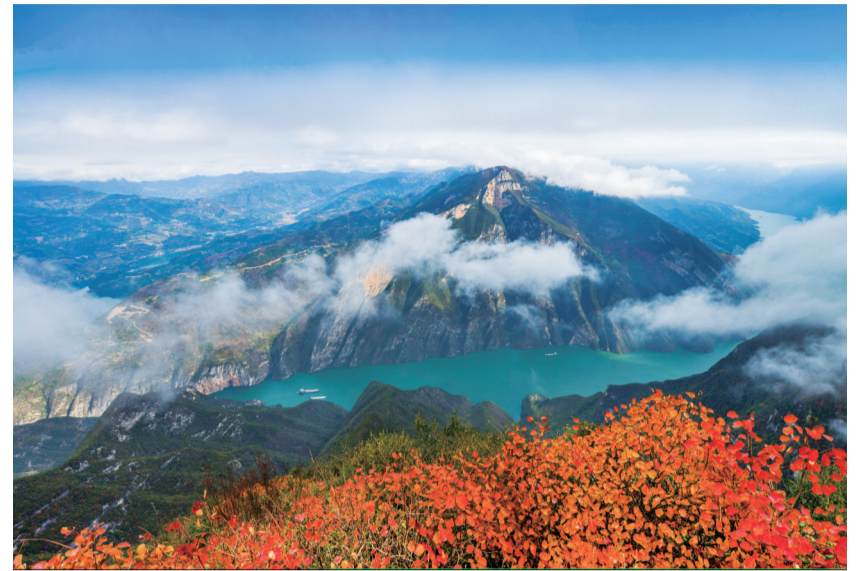
农业政策性金融守护一江碧水两岸青山，擘画三峡库区发展新图景

近日，农发行重庆市分行投放农村土地流转和土地规模经营贷款4000万元，支持黔江区蚕桑全产业链增品种、提品质、创品牌，走出乡村振兴新“丝”路。“该项目依托‘农