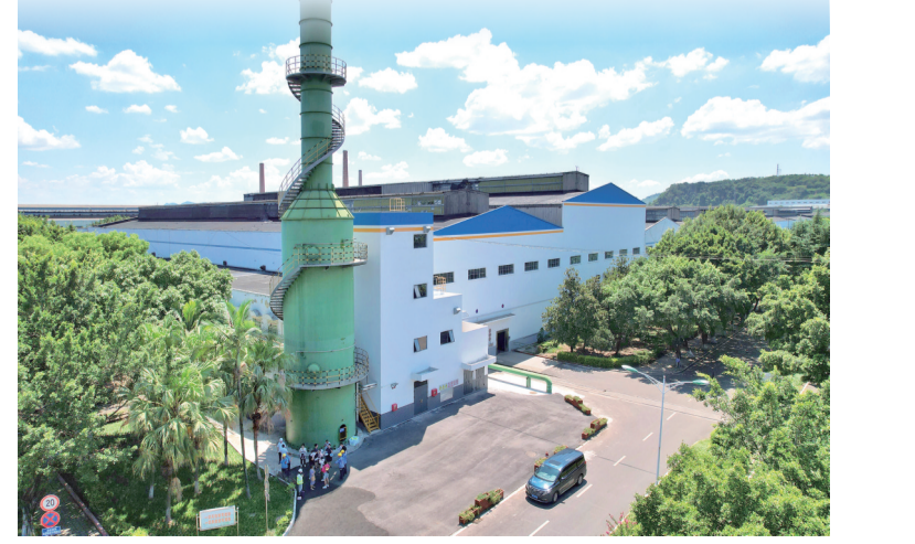
西南铝业(集团)有限责任公司轧机废钢回收再生项目

加快实施“三线一单”生态环境分区管控，划定自然保护区等优先保护单元31.03平方千米，进一步完善问题导向、精准管控、全域覆盖的生态环境分区管控体系，为全区重大政策科学决策、重大规划编制、重大生产力合理布局提供支撑。全年排查整治环境风险隐患299个，获得应急专利授权4项，连续17年未发生一般以上突发环境事件。