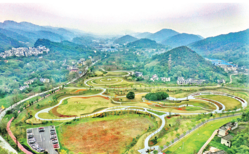
修复后的中梁山矿坑