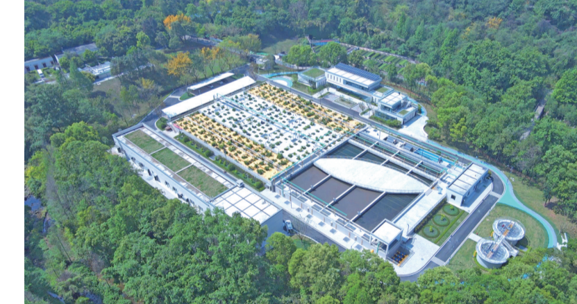
彩云湖污水处理厂