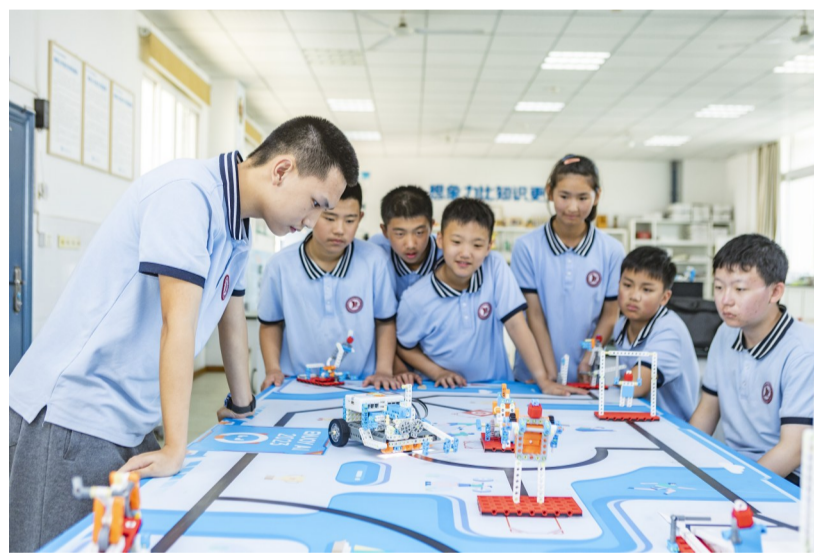
学校科学教育选修课

与此同时,学校打造30个学生社团,实施“走班式”社团活动,小荷文学社、人工智能社团、馨惠志愿服务社、浪涛之声广播社、亲海社被确定为市