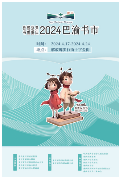
□新重庆-重庆日报 记者 聂晶

书香新重庆，爱阅新生活。每年4月，是重庆市全民阅读月。今年4月，各项阅读活动异彩纷呈、形式丰