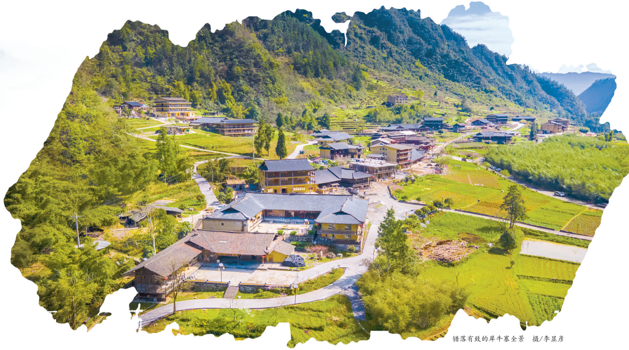
错落有致的犀牛寨全景

在市、区住房城乡建委的大力支持指导下，武隆区土地乡始终坚持保护利用与发展并重，重点围绕加强传统风貌保护、传统建筑修缮、历史遗存保护、村落人居环境整治提升、村落基础设施和公共服务设施完善等方面，大力实施传统村落保护利用，加快推动“世外桃源犀牛寨·中国醉美古村落”建设，让古村落村庄焕发“时代生机”。