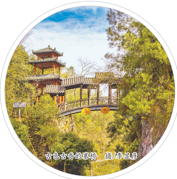
古色古香的寨桥

目前，犀牛寨传统村落保护发展成效初显：犀牛寨吊脚楼传统建筑修缮和风貌规范、广场及戏楼建设，犀牛池及景观引水、污水管网和电线入地、庭院美化等工程已经