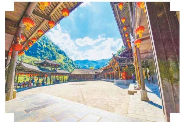
载着闲情惬意的寨广场