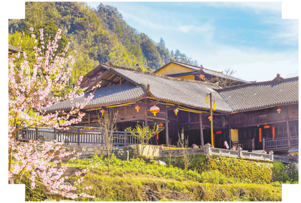
民居建筑飞檐翘角，独有韵味