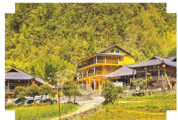
犀牛寨的一角