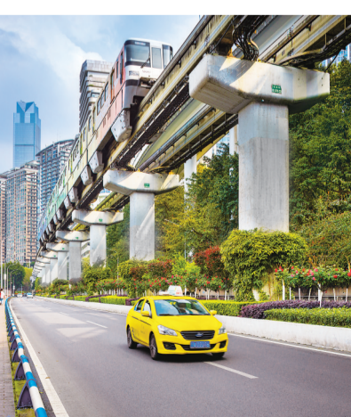
轨道交通二号线黄花园站